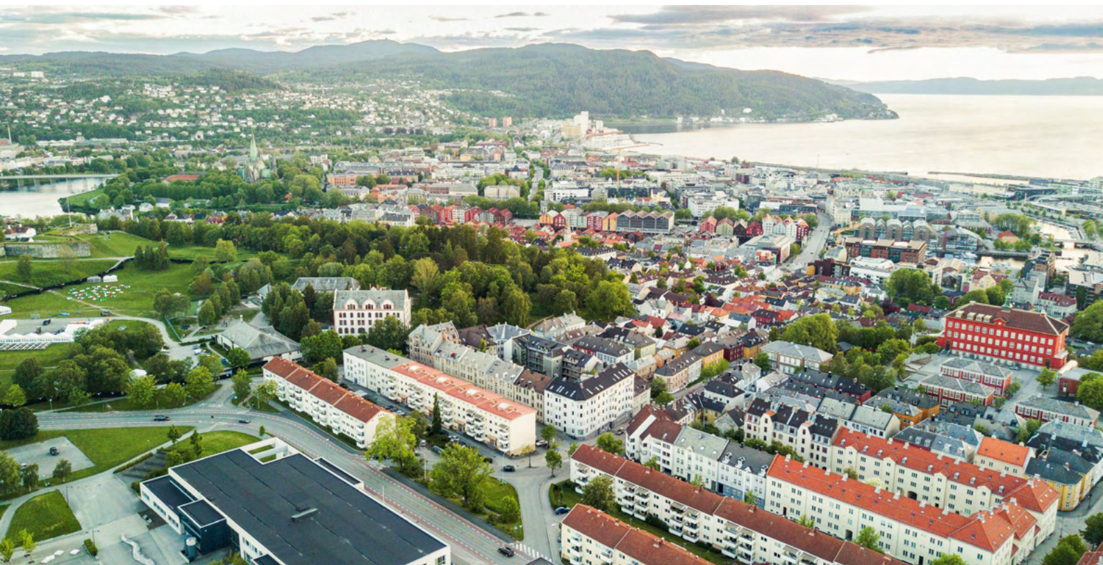
Fra Rosenborg mot Midtbyen.