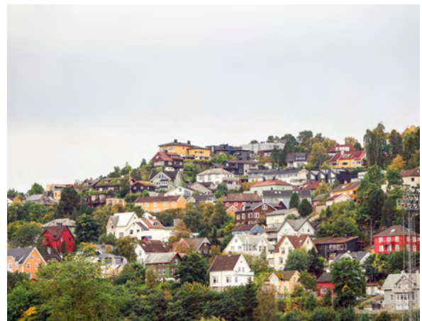
Utsikten, sett fra Ila viser bysilhuetten av småhusbebyggelse.