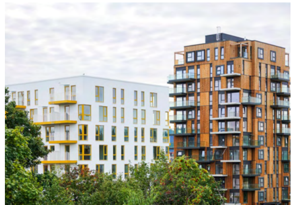
Høyhus på Nye Lilleby vokser frem blant trærne.