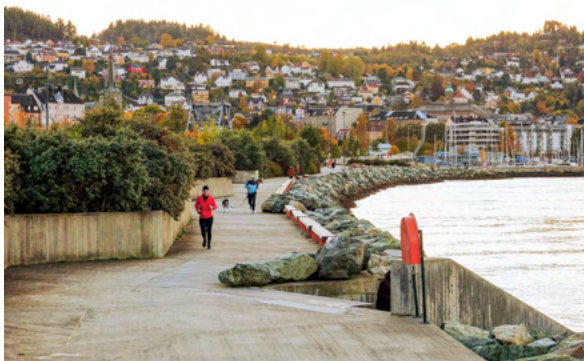
Pirpromenaden ligger ytterst mot fjorden og tilgjengeliggjør sjøfronten.