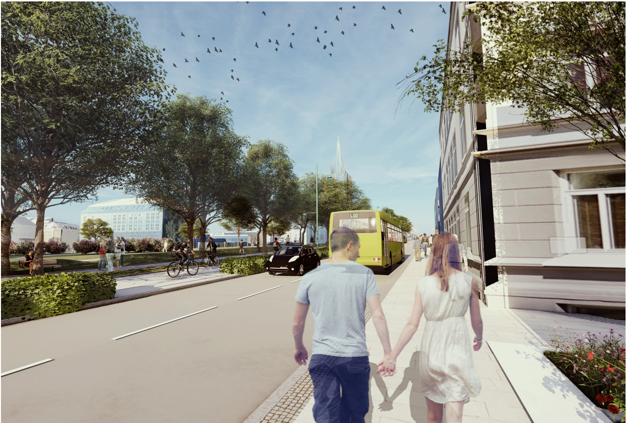
Illustrasjon: Asplan Viak