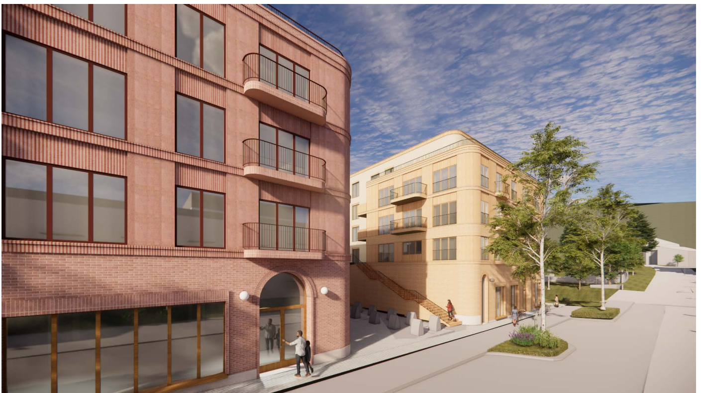
Passasjen mellom bygårdene