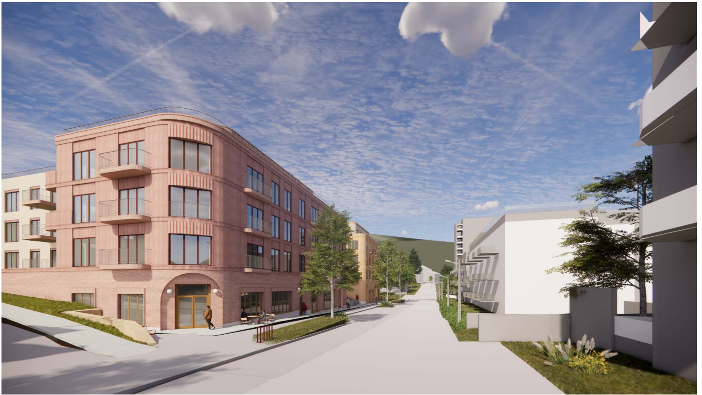
Hanskemakerbakken fra vest