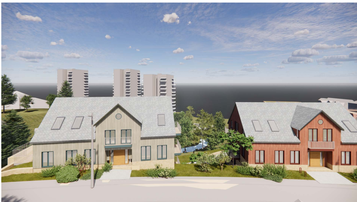
Grøntdrag Grønne åpninger mellom byggene med utsikt ut mot fjorden.