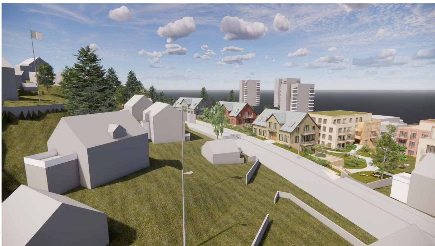
Roal Amundsen vei