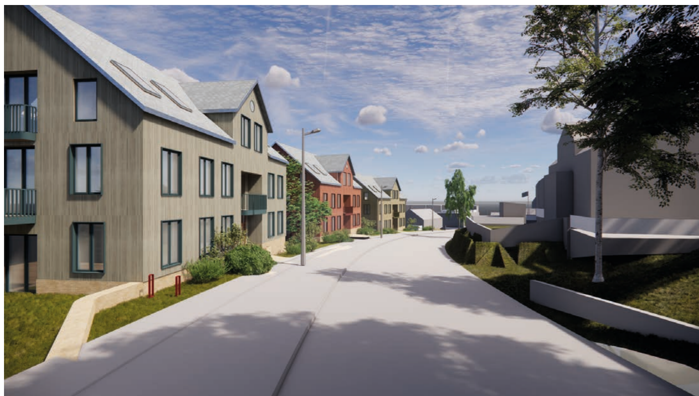
Skala som snakker sammen Oppdeling av volumene og satt mønehøyde skaper et balansert gatesnitt.