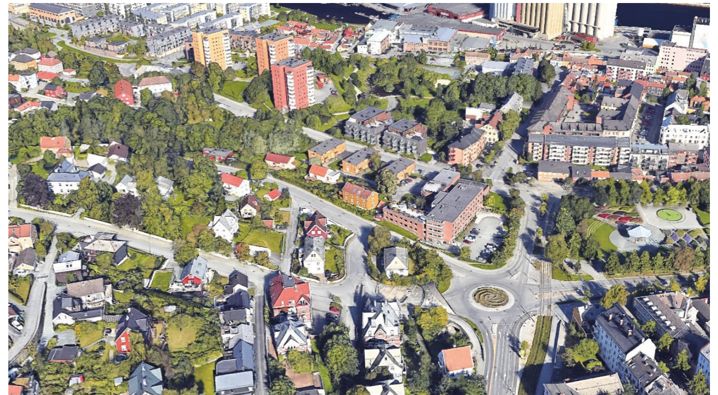
Fra sørøst Eksisterende situasjon