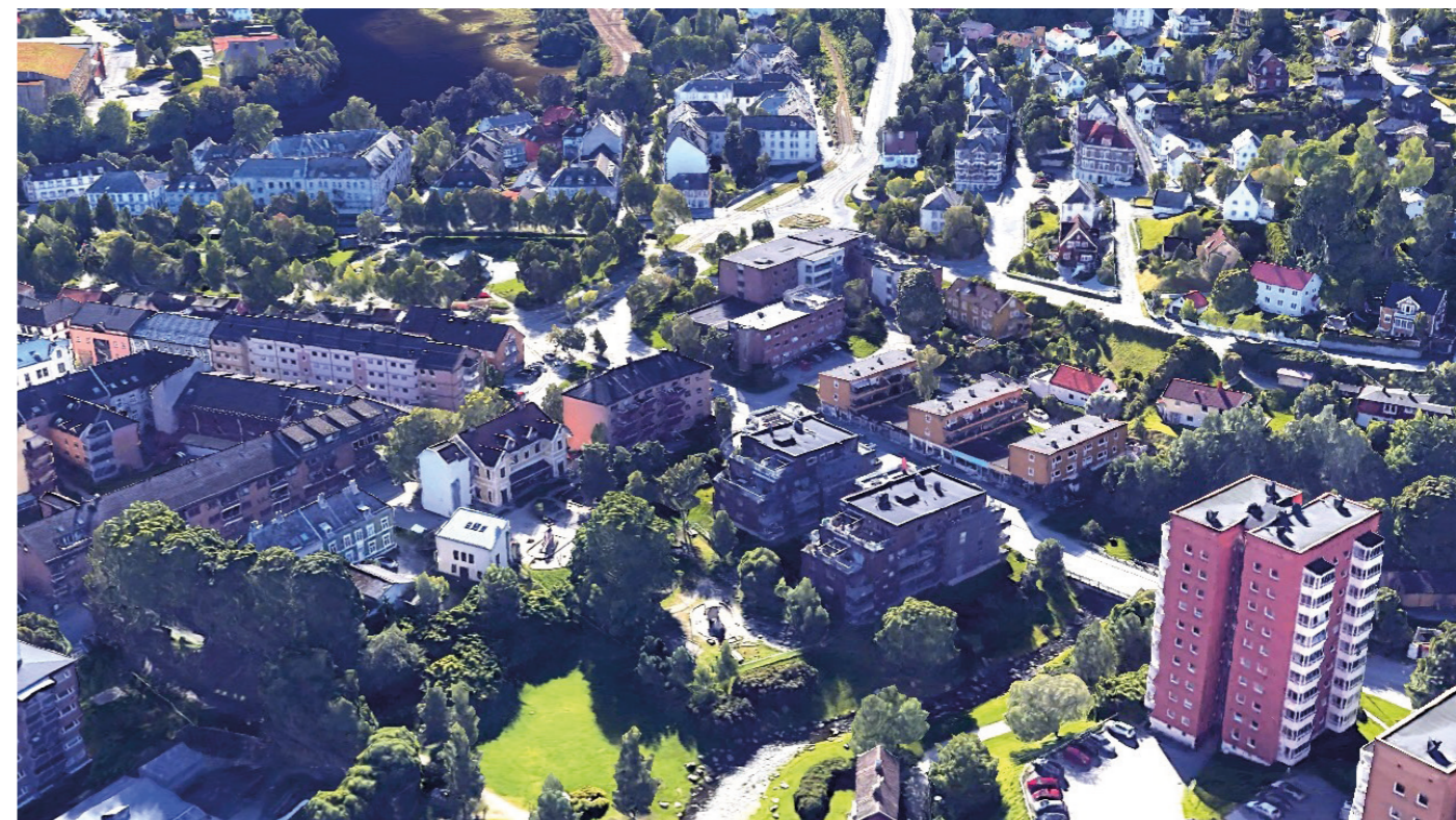
Fra nordvest Eksisterende situasjon fra Google Maps