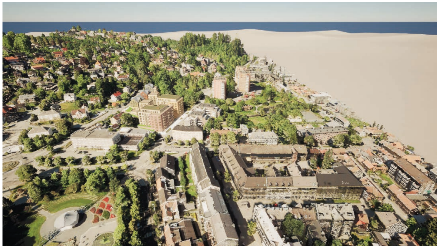
Fra øst Ny situasjon