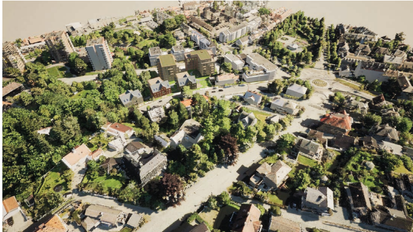
Fra sør Ny situasjon