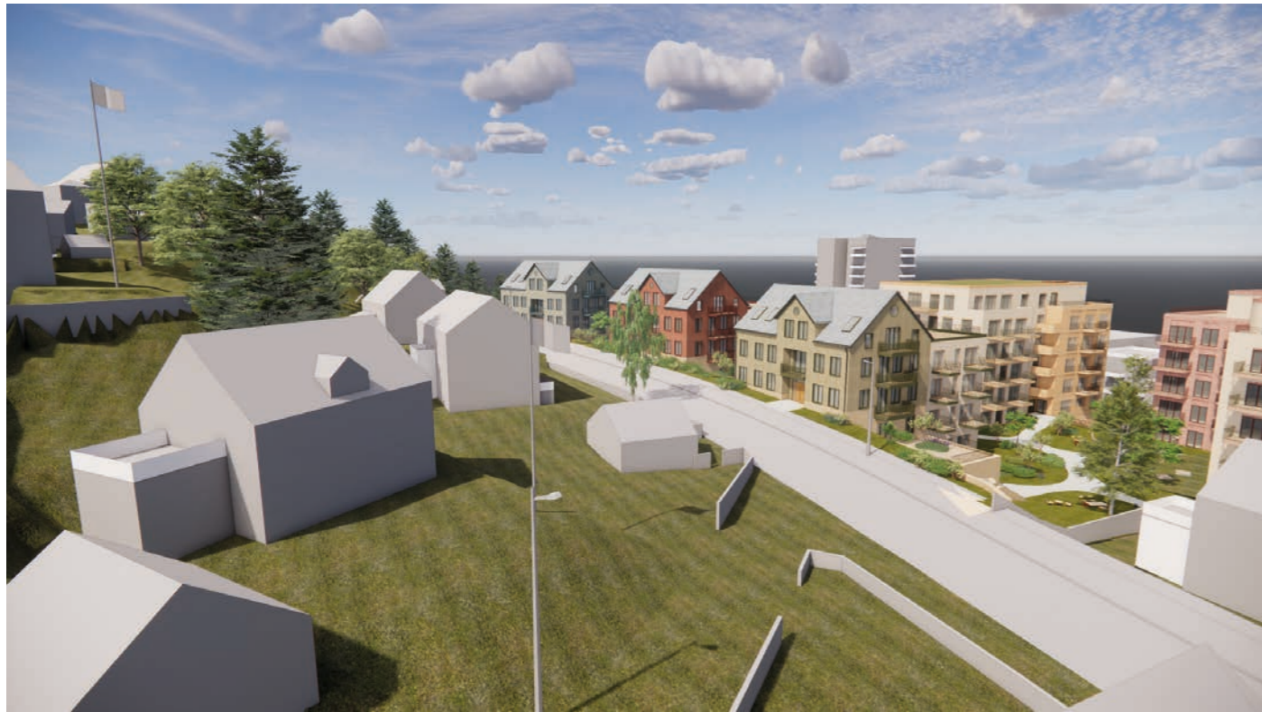
Roal Amundsen vei Tre boligbygg i samme formspråk som eksisterende omkringliggende bebyggelse.