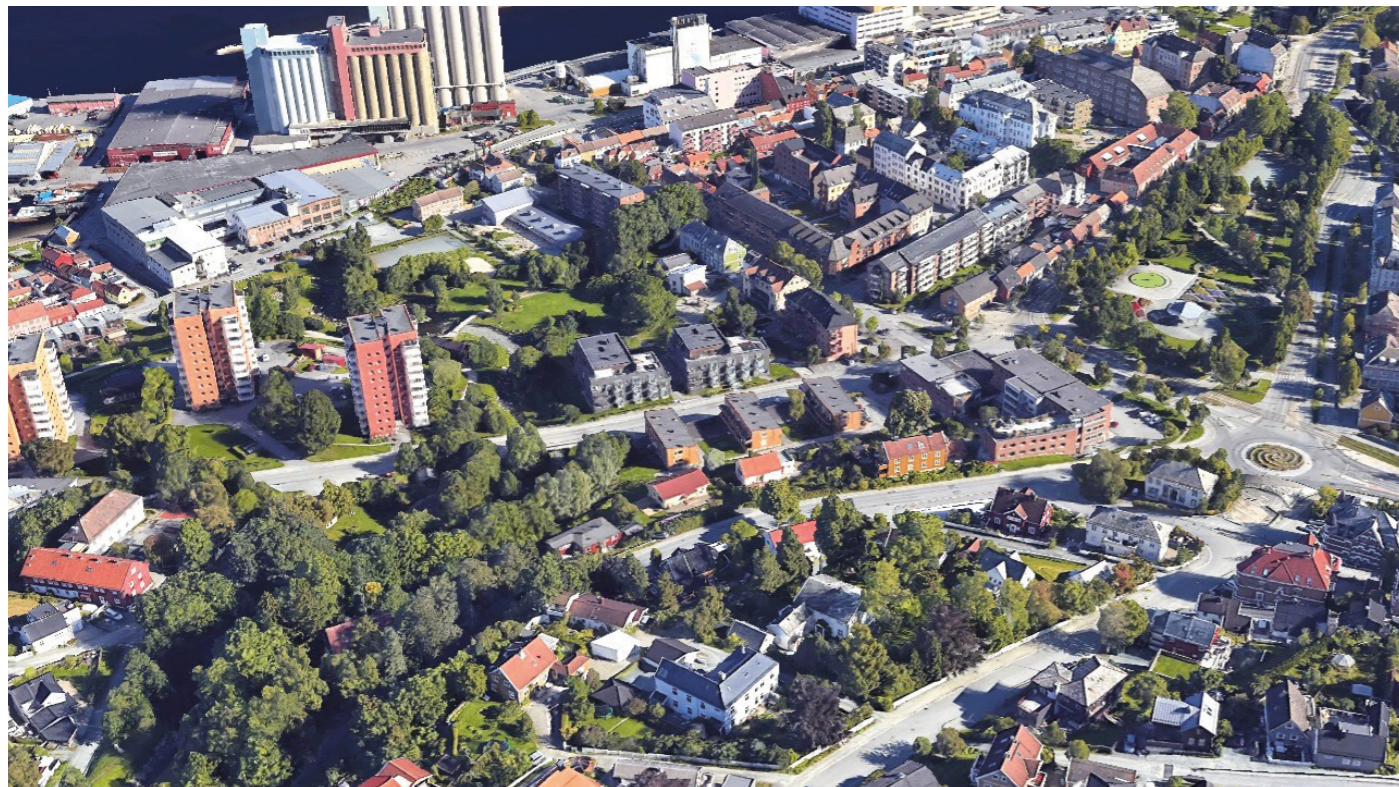
Fra sør Eksisterende situasjon fra Google Maps