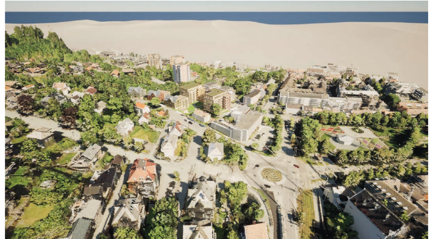
Fra sørøst Ny situasjon