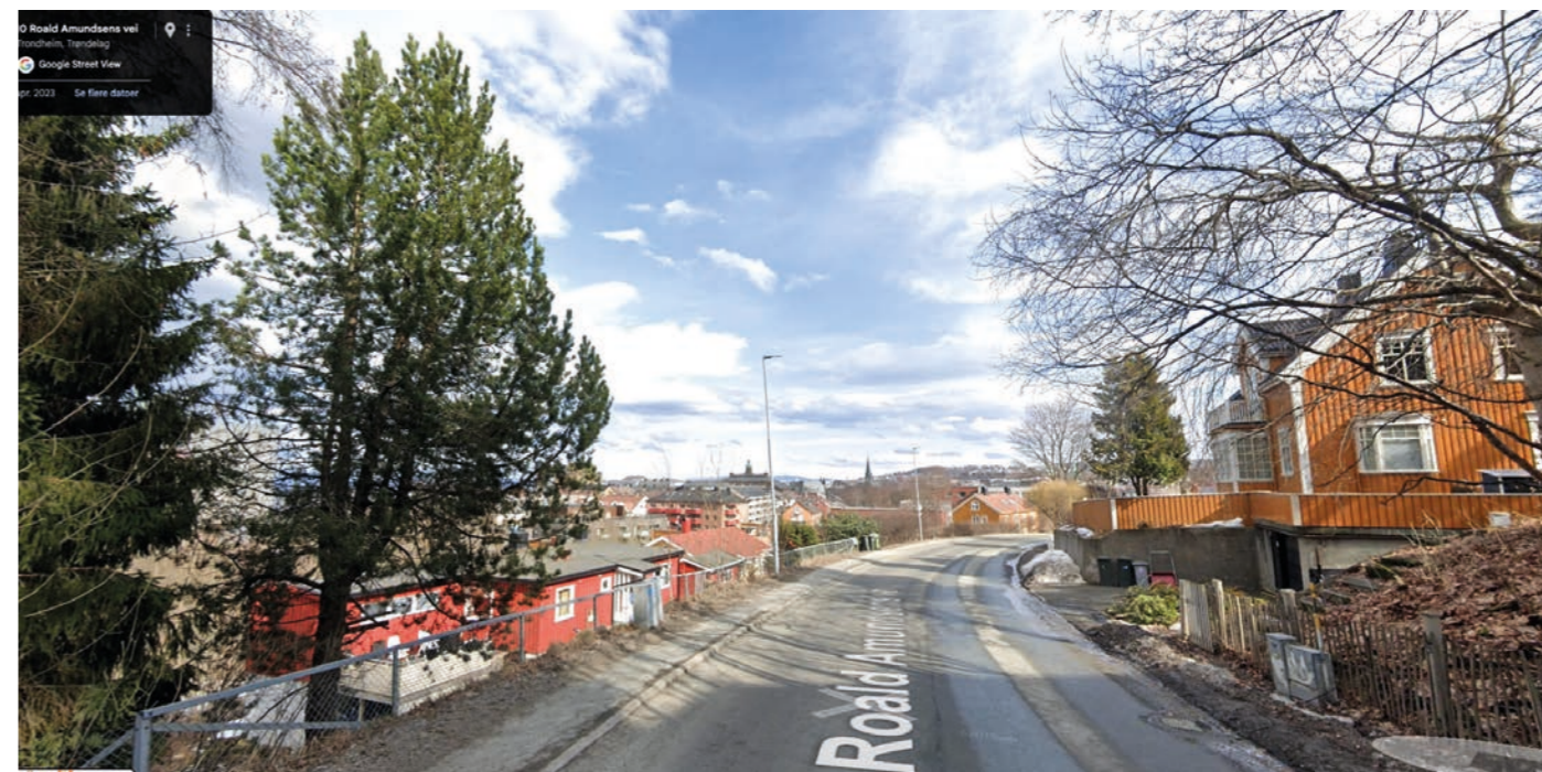
Fra Google Street View