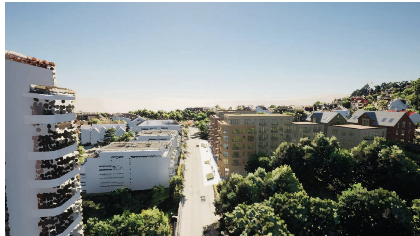
Fra vest Ny situasjon