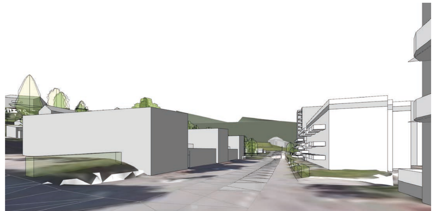
Eksisterende situasjon fra modell