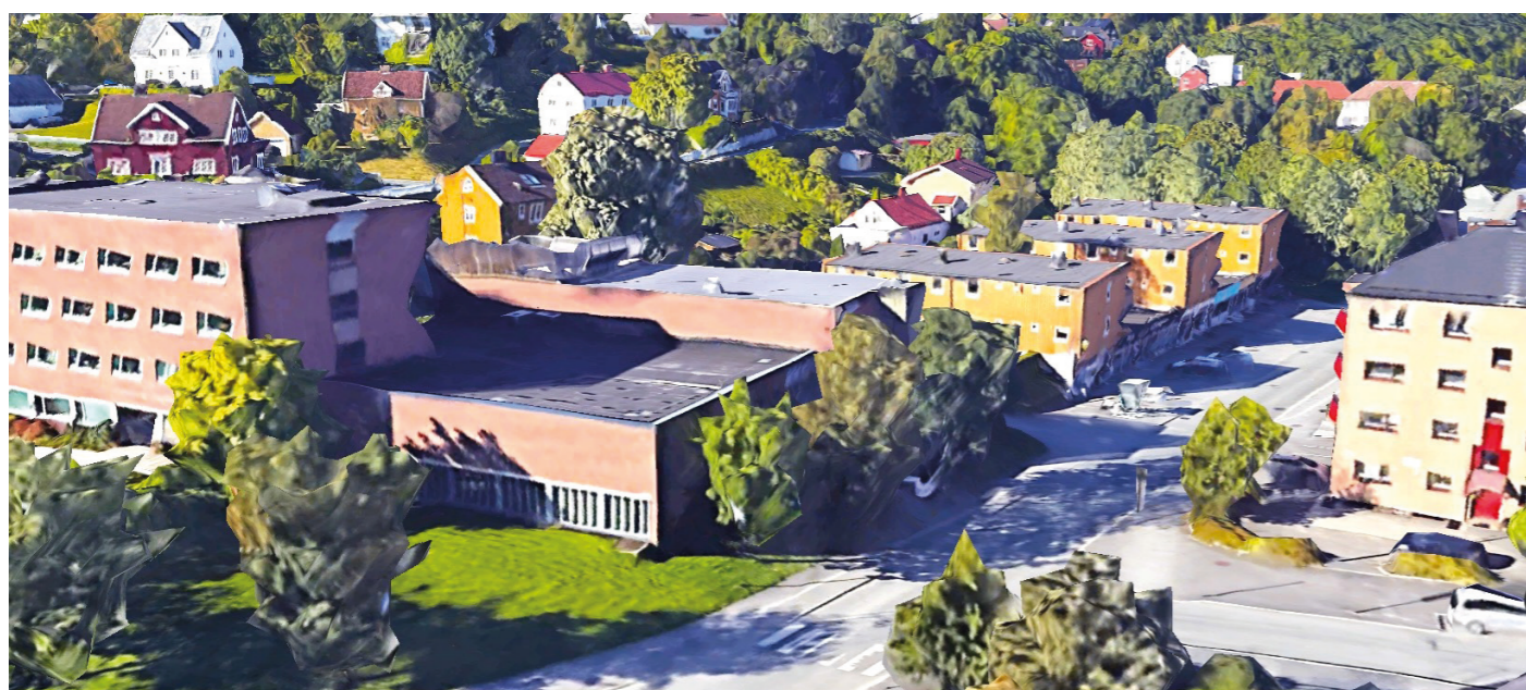
Fra øst Eksisterende situasjon fra Google Maps