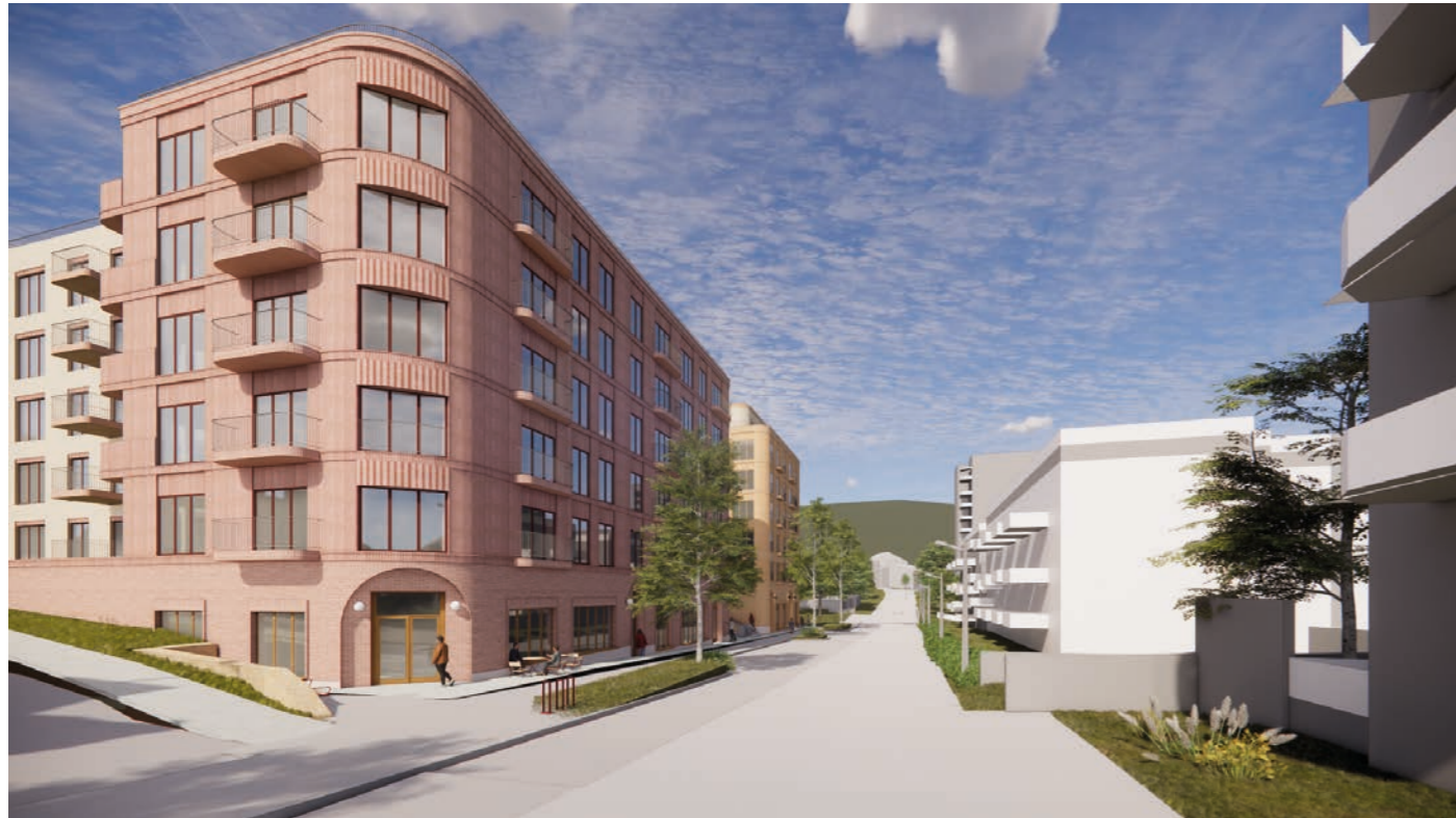
Hanskemakerbakken fra vest Næring i 1. etasje og en variasjon av boliger i 2. etasje og oppover.