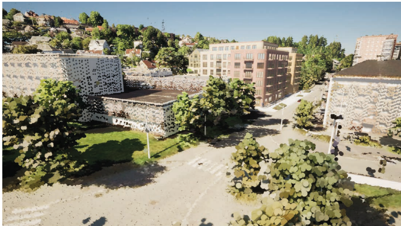
Fra øst Ny situasjon