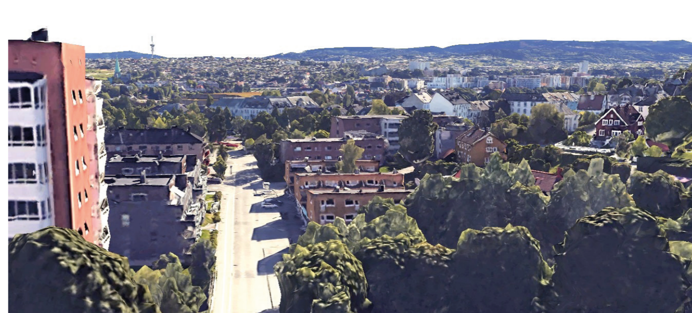
Fra vest Eksisterende situasjon fra Google Maps