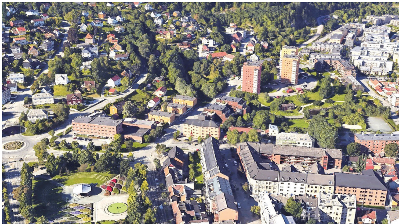
Fra øst Eksisterende situasjon fra Google Maps