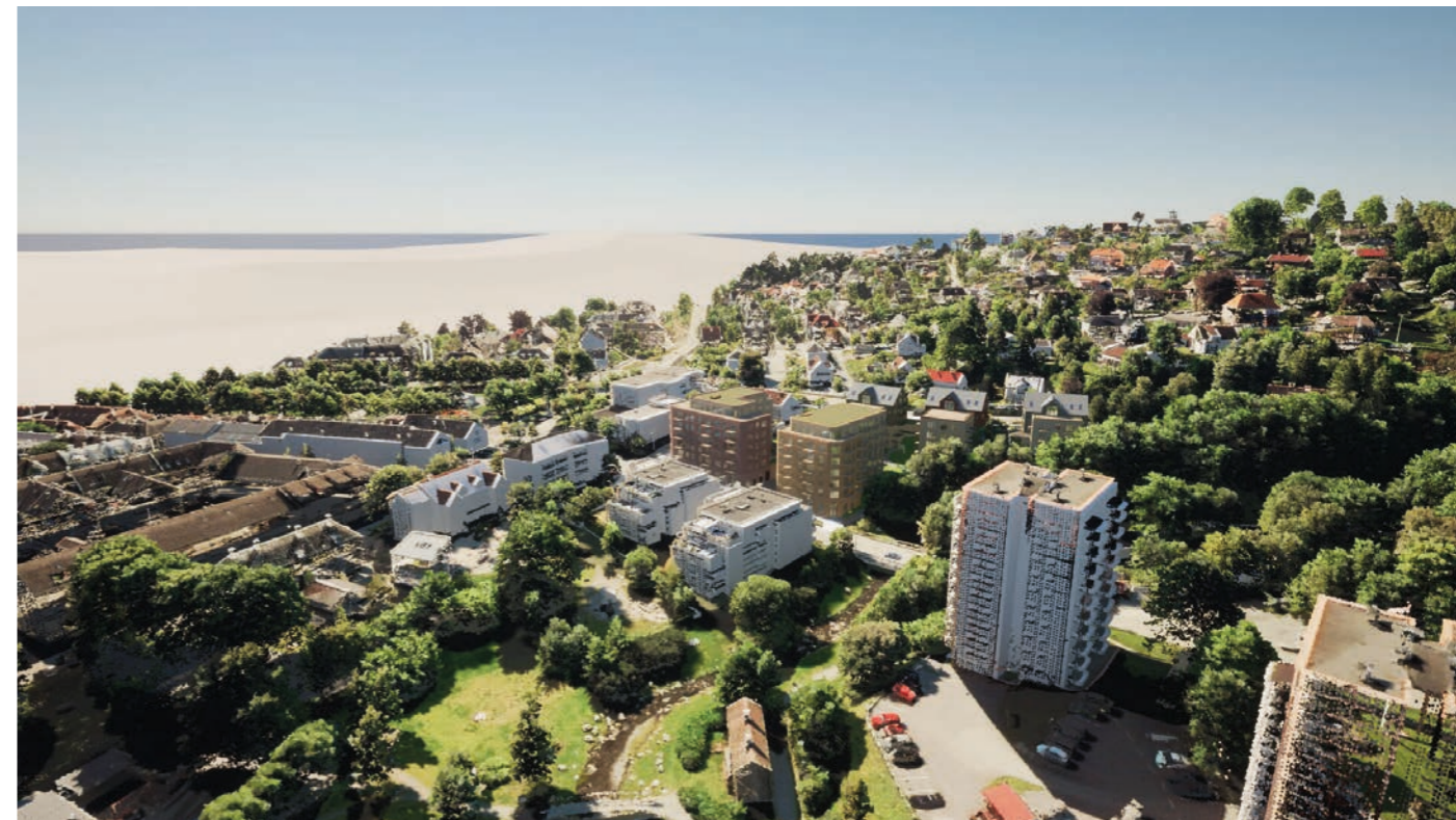
Fra nordvest Ny situasjon