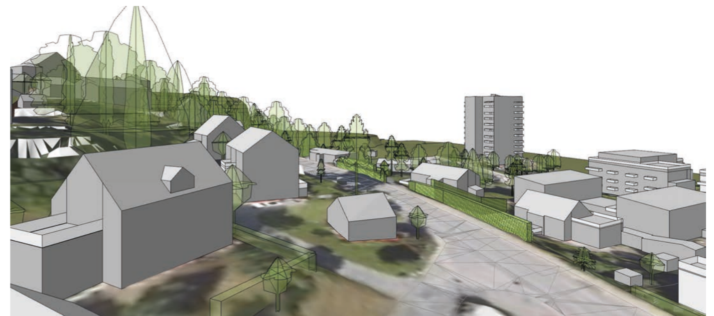
Eksisterende situasjon fra modell