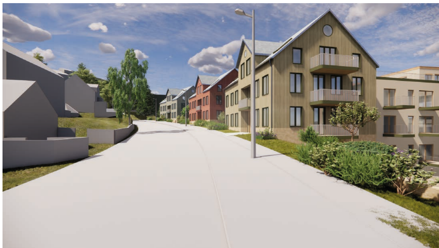
Flermannsbolig Alle tre byggene rommer flere leiligheter i ulike størrelser.