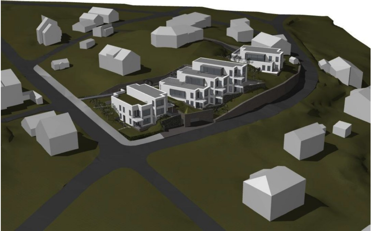
Perspektiv fra Møllebakken mot øst