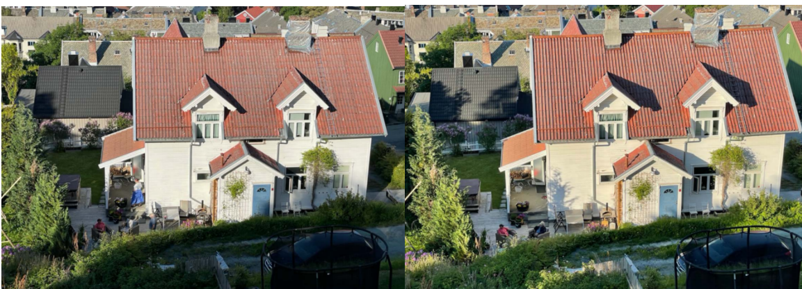
Dagens situasjon 9. juni kl. 19.00 (til venstre) og kl. 20.00 (til høyre)

Dokumentasjonen i saken viser at nabo i Bryns vei 9 sitt uteoppholdsareal i nordvest i dag mister sola på bakken før kl. 19.00 ved midtsommer i juni. Dette er som følge av bakenforliggende bebyggelse, terreng eller vegetasjon. Inntil den nordvestre husveggen er det solgløtt som i begrenset omfang treffer oppsatte stoler etter kl. 19.00, og som gradvis minsker frem mot kl. 21.00. Planforslaget medfører at naboeiendommen mister det minskende solgløttet inntil husveggen etter kl. 19.00, men vil likevel ha sol på flere uteoppholdsareal fra tidlig morgen, samt i vest og sørvest frem til litt før kl. 20.00 ved midtsommer.