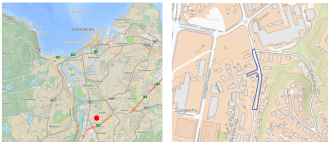
Figur 1 Oversiktskart (til venstre) og planavgrensning (til høyre)

Det mangler et sammenhengende tilbud for gående og syklende langs Klæbuveien. Hensikten med planen er å sikre myke trafikanter ved å etablere fortau langs vestre del av Klæbuveien. Planområdet er på ca. 3,0 daa. Veggen er skoleveg til Nidarvoll barneskole og Sunnland ungdomsskole. I tillegg er Klæbuveien en del av hovedsykkelnettet.