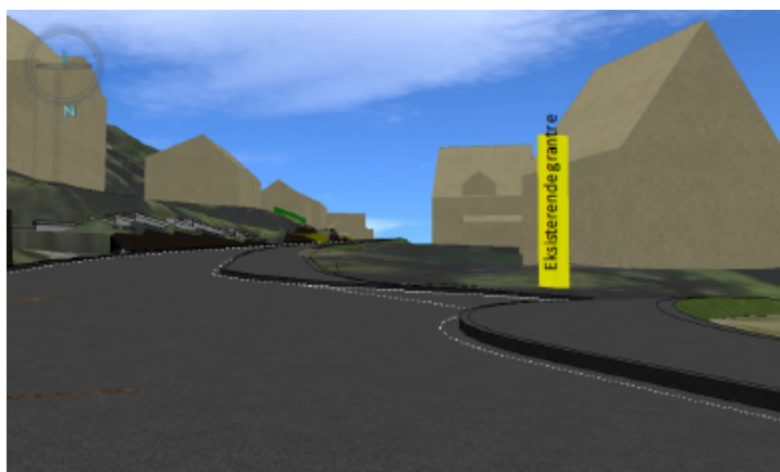
Figur 3 Perspektiv fra vegmodell – Kryss Klæbuveien - Øystein Møylas veg

Nordvest i planområdet reguleres det for kollektivholdeplass. Holdeplassen skal utformes som kantsteinholdeplass med plass til leskur. Reguleringsbestemmelsene inneholder retningslinjer om at holdeplassen skal utformes slik at det unngås konflikt mellom av- og påstigende og forbigående syklist og gående.