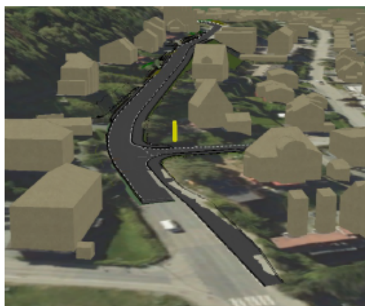
Fugleperspektiv fra vegmodell