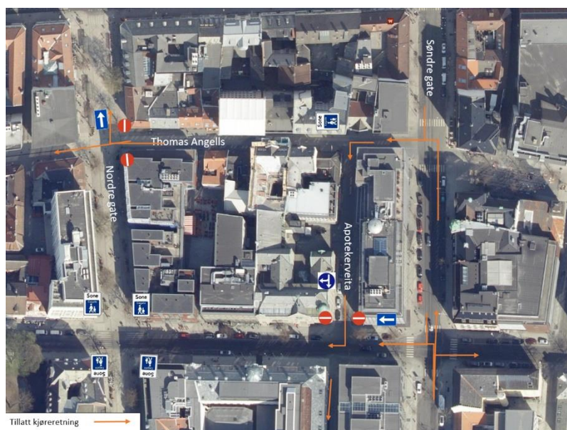
Figur 1 Dagens situasjon

Dronningens gate er i dag enveiskjørt, med parkering og bussoppstillingsplass på nordsiden. Det er to HC-parkeringsplasser foran Dronningens gate 10. Sørsiden har taxi-holdeplasser og holdes ledig for vareleveringer og persontransport