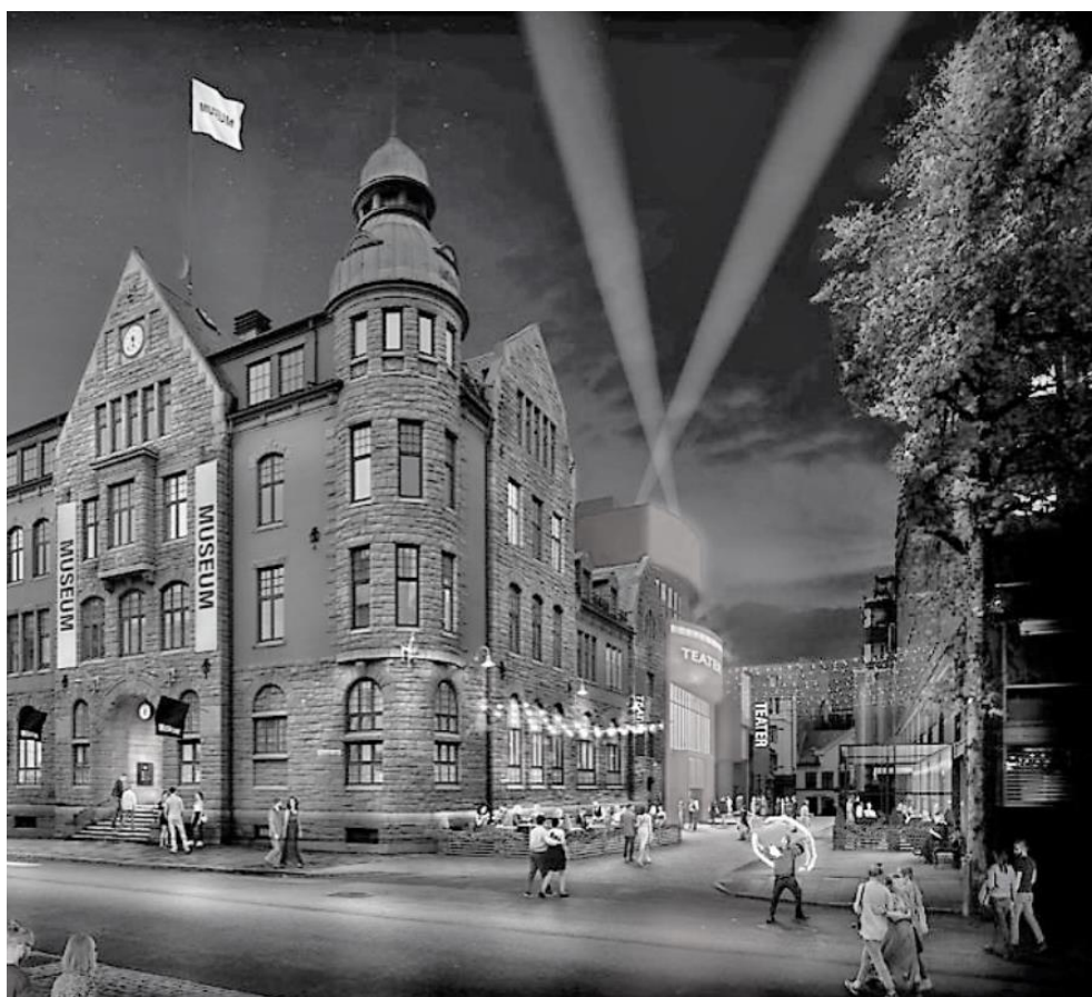
Trafikknotat Dronningens gt 10 m.fl./Nye Hjorten Teater