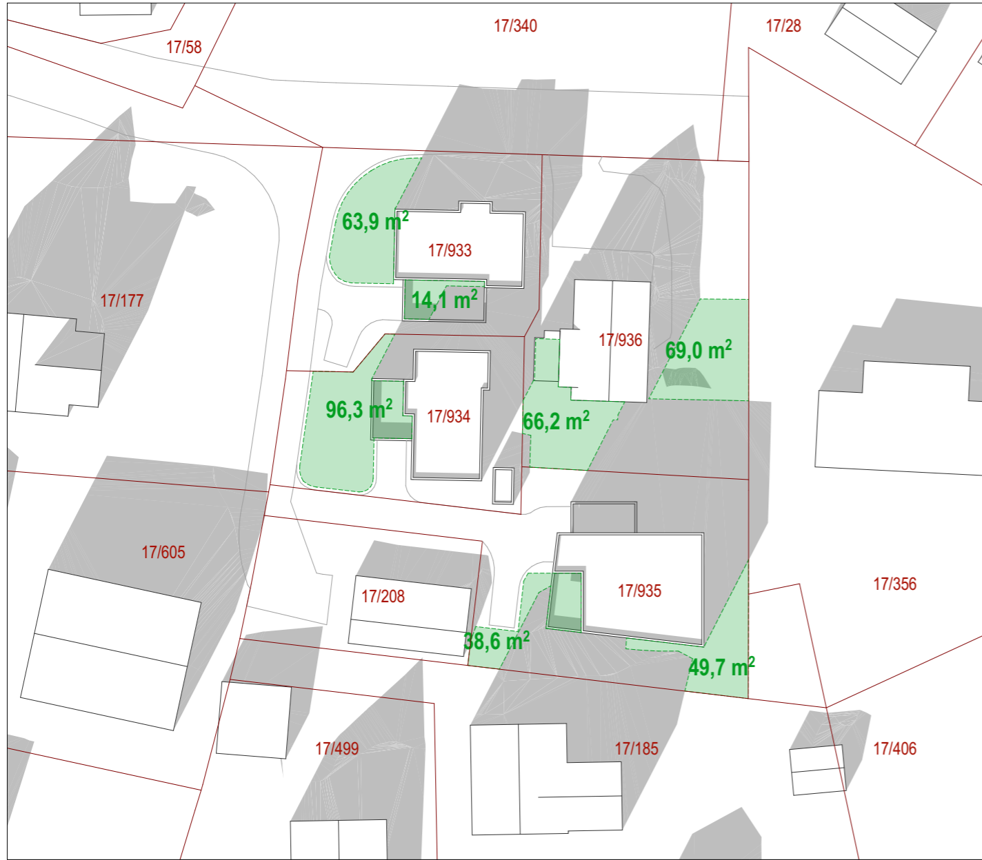
SOL 21 mars kl 15