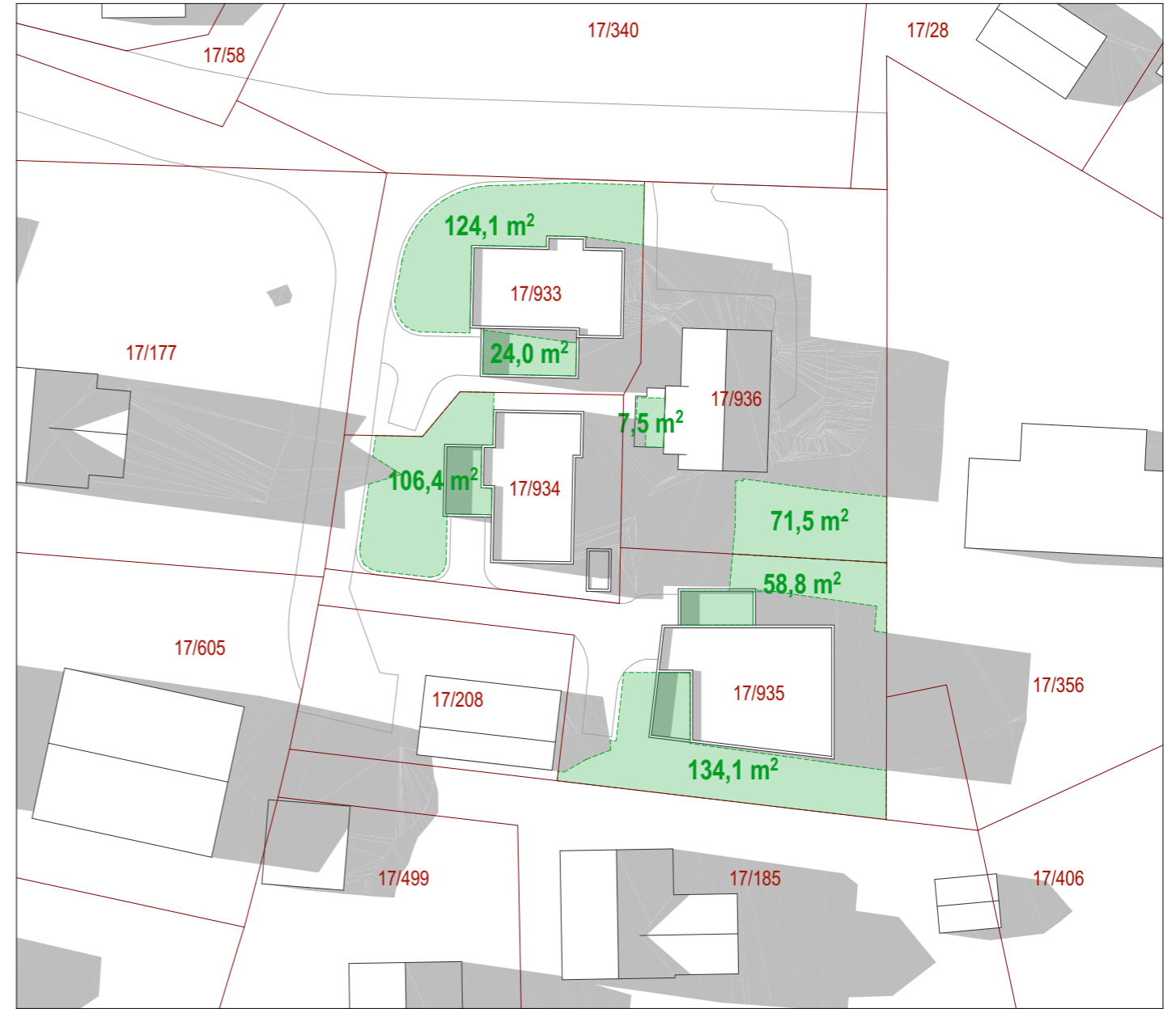
SOL 23 juni kl 18