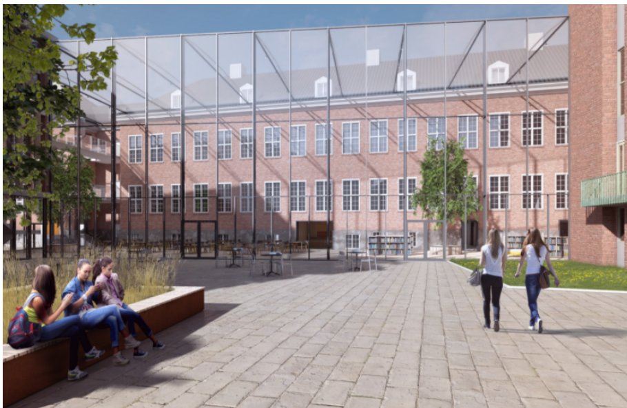
Illustrasjon av mellombygget mener Kommunedirektøren gir et noe misvisende inntrykk av hvordan bygget vil fremstå.

Å etablere ny bygningsmasse i et av Midtbyens få åpne større byrom vurderes å være utfordrende. Det har vært lagt vekt på at utvidelsen må gi vesentlige forbedringer av byrommet som blir igjen, som uteareal til elever og ansatte ved skolen, og også som et byrom for alle. Det har vært spesielt viktig å bevare muligheten for at gårdsrommet fortsatt kan brukes som oppstillingsplass ved større arrangement. Kommunedirektøren vurderer at nybygg og skolebygg i gårdsrommet har en negativ betydning for byrommet som en stor åpen plass, men at dette er akseptabelt.