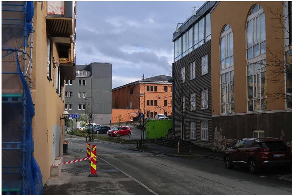
Før - sett fra Mellomila mot øst. Standpunkt øyehøyde, 50mm linse.