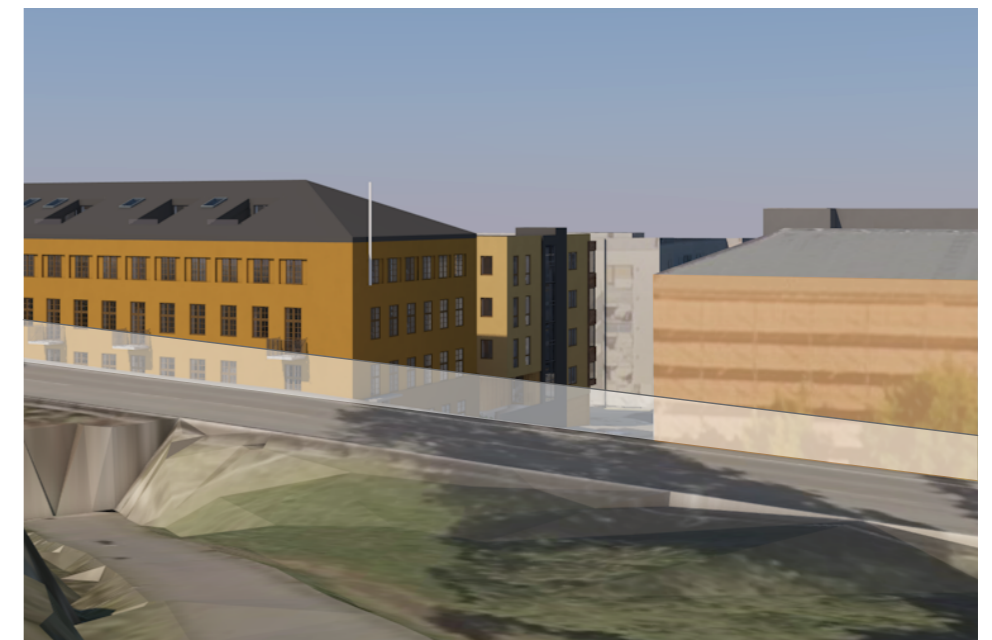
Alternativ B: Nybygg 4 etasjer, maks høyde under gesims på antikvarisk bebyggelse