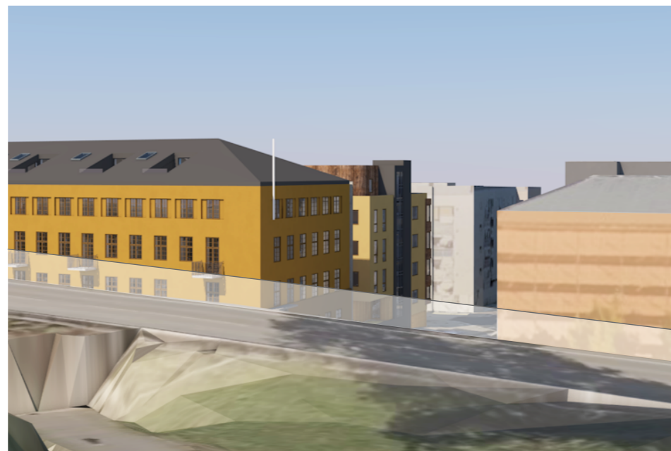
Alternativ A: Nybygg med 4 boligetasjer + inntrekk 5. etasje