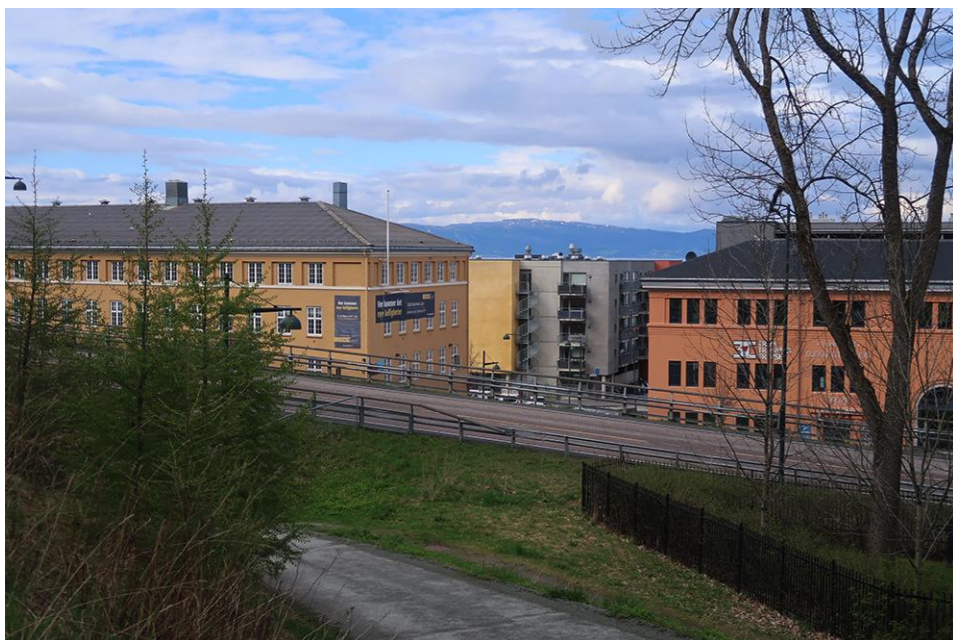
Før - sett fra Bynesveien mot nord. Standpunkt øyehøyde, 50mm linse.