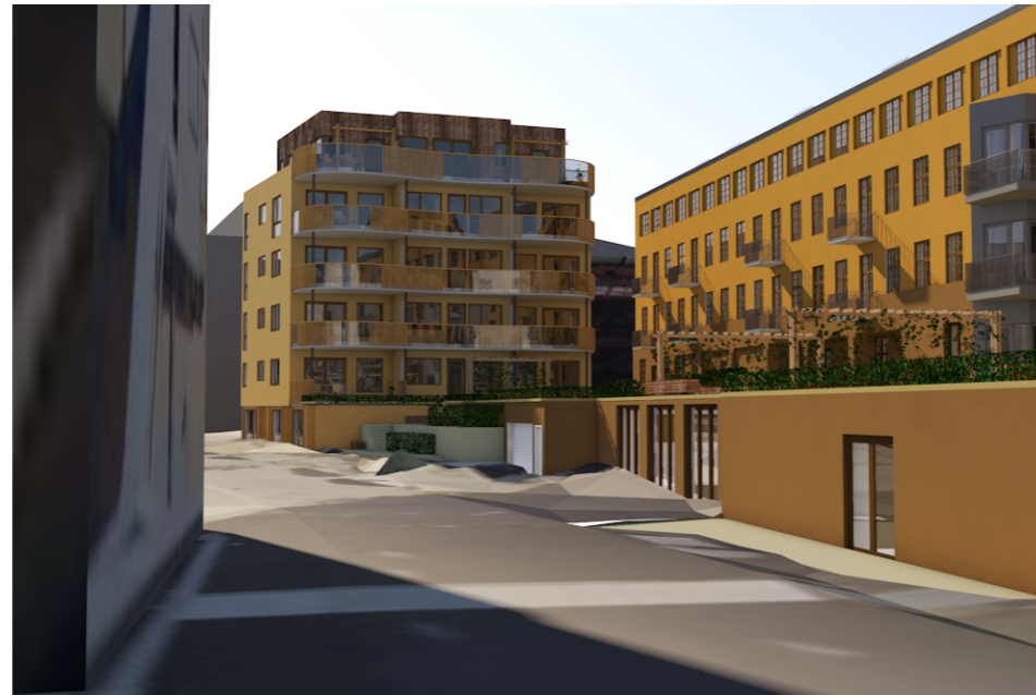
Alternativ A: Nybygg med 4 boligetasjer + inntrekk 5. etasje