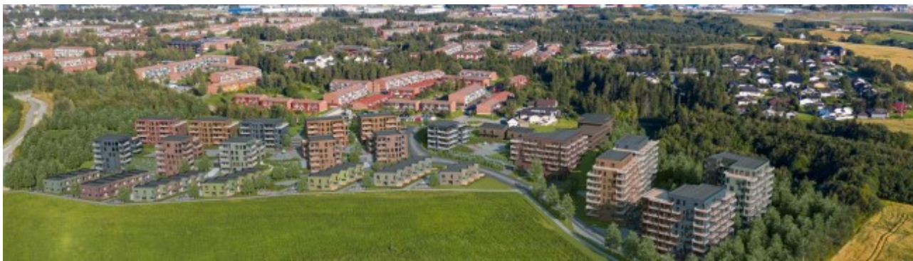
Figur 4 Illustrasjonsbilde. Planområdet sett fra vest.