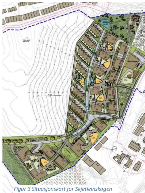
Figur 3 Situasjonsskart for Skjetleinskogen

Planen legger til rette for en offentlig barnehage nordøst i planområdet. Tomta er på ca. 4 daa, noe som vil gi plass for en 6 avdelings barnehage. Parkering samt bringe- og hentetjenesten skal løses på egen grunn.