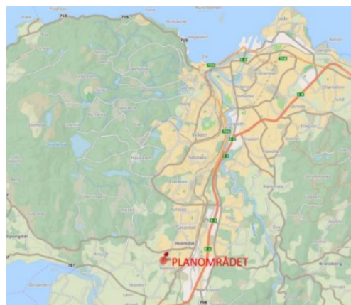
Figur 1 Oversiktskart, planområdet vises som rød markør

Planområdet er på ca. 39 daa og ligger sør i Trondheim kommune. Planområdet har tidligere vært skogkledd, er ubebygget i dag og består i hovedsak av kuperte terrengformer. Øst for planområdet ligger deler av den karakteristiske bebyggelsen på Kattem fra 70-tallet.