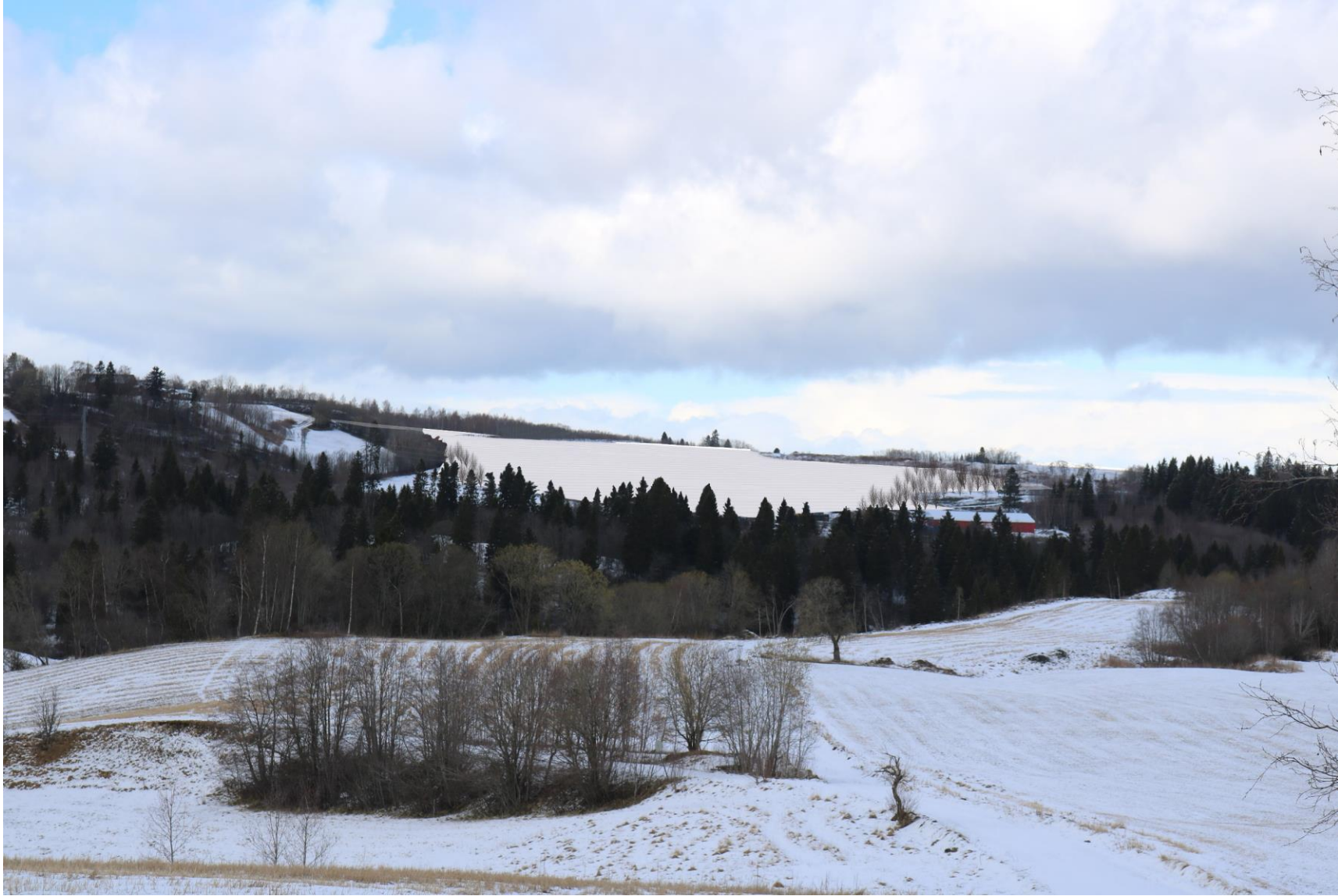
Figur 5 Oppfylling av området sett fra standpunkt 2, Nordtiller. Bebyggelse er fjernet og noe ny vegetasjon i ytterkant er tatt inn.