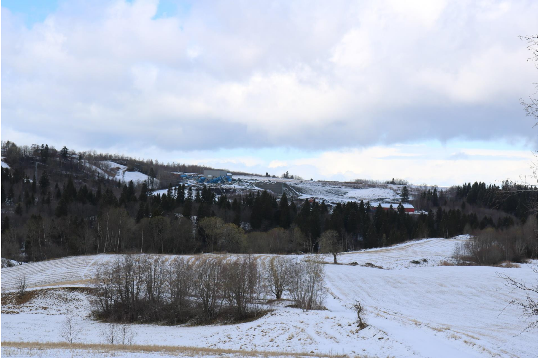
Figur 4 Originalbilde fra standpunkt 2 – Nordtiller