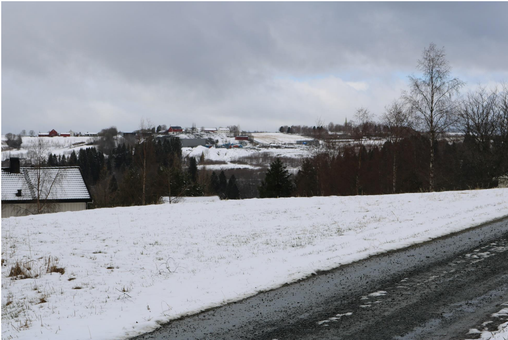
Figur 2 Originalbilde fra standpunkt 1 – Amundsdalvegen