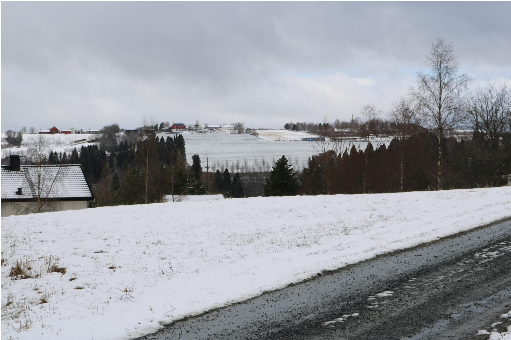
Figur 3 Oppfylling av området sett fra standpunkt 1, Amundsdalvegen.