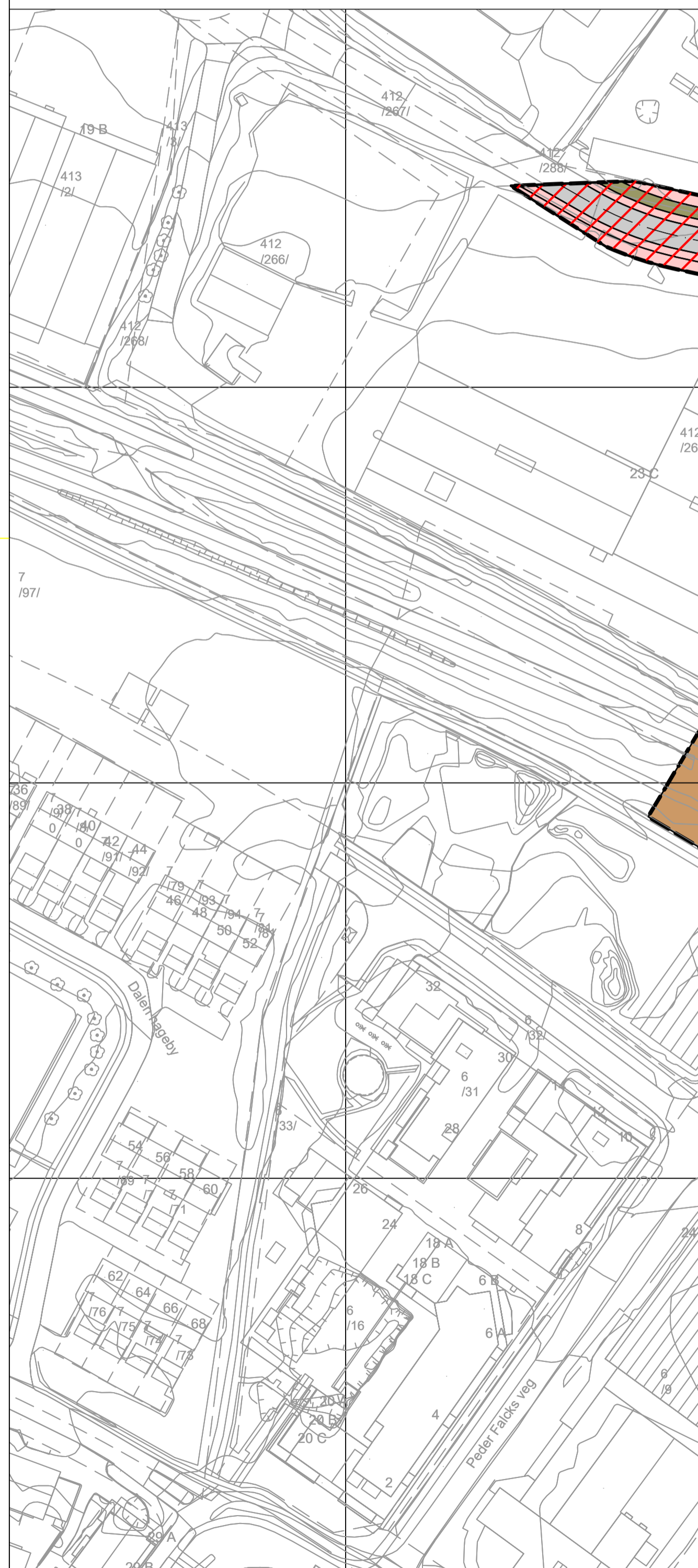
Vertikalnivå: 2 Bakkeplan