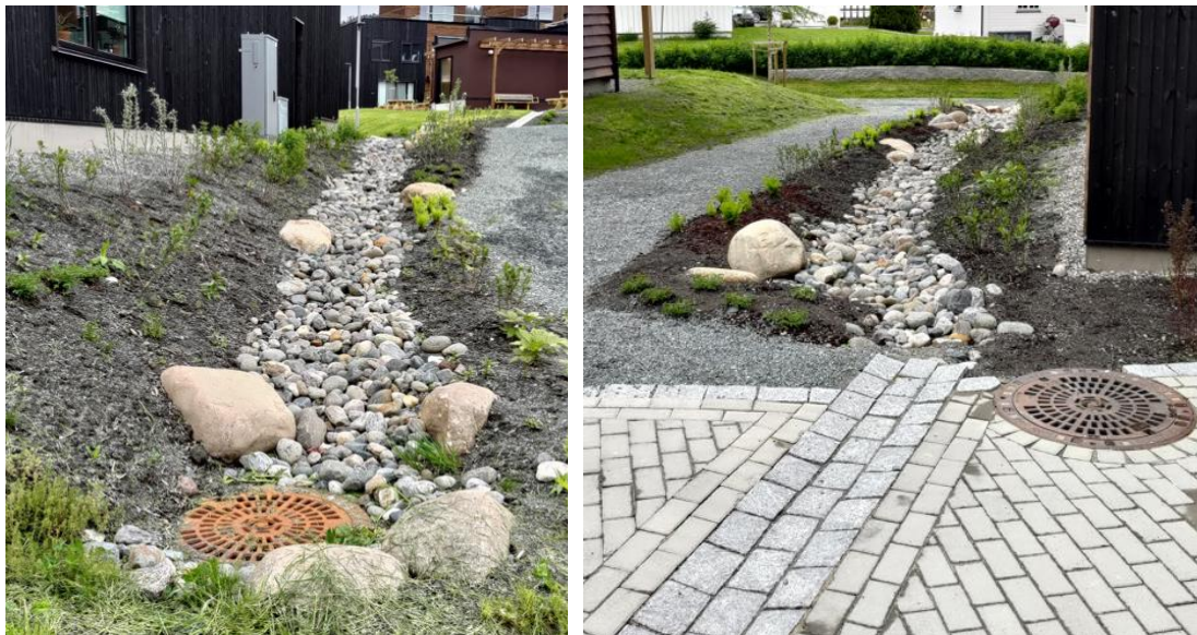
Figur: Bilder over viser «fuktbed» og åpne vannveger Overvik B1.

Utstrekning av bruk, og egnethet, for de ulike metodene for naturbasert overvannshåndtering skal vurderes i detaljeringsfase av VA-rådgiver i samråd med relevante fagrådgivere.