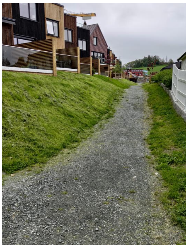
Figur: Bildet over viser turveg dimensjonert som flomveg på Overvik delfelt B1.

Trygge flomveger internt på planområdet sikres ved at det etableres fall bort fra bygg med tilstrekkelig overhøyde til vannveier. Vannveier med fall mot vest etableres gjennom planområdet. Adkomstveger, grøntarealer, og G/S-veger kan etableres i lavbrekk og fungere som flomveger. For beregning og dimensjonering av flomveger, se H-not.01 Overvik - Områdeplan flom og flomveger.