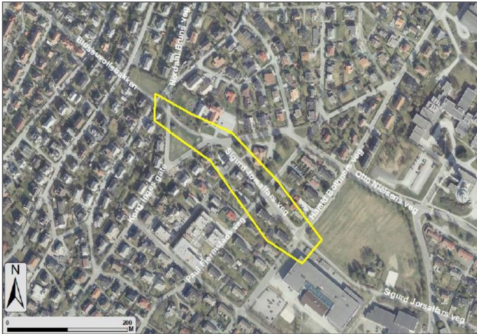
Figur 1: Utsnitt av planområdet som skal reguleres, Kong Inges gate-Harald Bothners veg