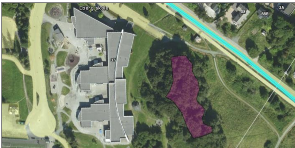
Figur 4: Lilla polygon viser registrert naturtype, gammel lågurtospeskog, ved Eberg skole i forbindelse med kartlegginger for planarbeidet for Eberg aktivitetspark.

I forbindelse med planarbeid for Eberg aktivitetspark er det utført kartlegging av naturtyper. Deler av planområdet for Eberg aktivitetspark inngår i reguleringsplan for Brøsetruta. Registreringen er gjort sør for Sigurd Jorsalfars veg og øst for Eberg skole, i Bekkevoldalen. Naturtypen som er registrert er en gammel lågurtospeskog som er gitt høy lokalitetskvalitet. Registreringen er vist i Figur 4.