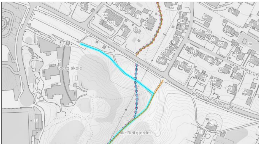
Figur 5: Registrerte turstier langs Sigurd Jorsalfars veg.

Midt på strekningen, ved Eberg skole, er det en tursti som krysser Brøsetruta. Dette er et grønt turdrag som både brukes som snarveg og til rekreasjon. På sørsiden av Sigurd Jorsalfars veg starter turvegen tvers ovenfor Ole Hogstands veg. Det er registrert en skiløype fra Eberg skole som møter på turveg sør for Sigurd Jorsalfars veg. En oversikt over turstiene er vist i Figur 5.