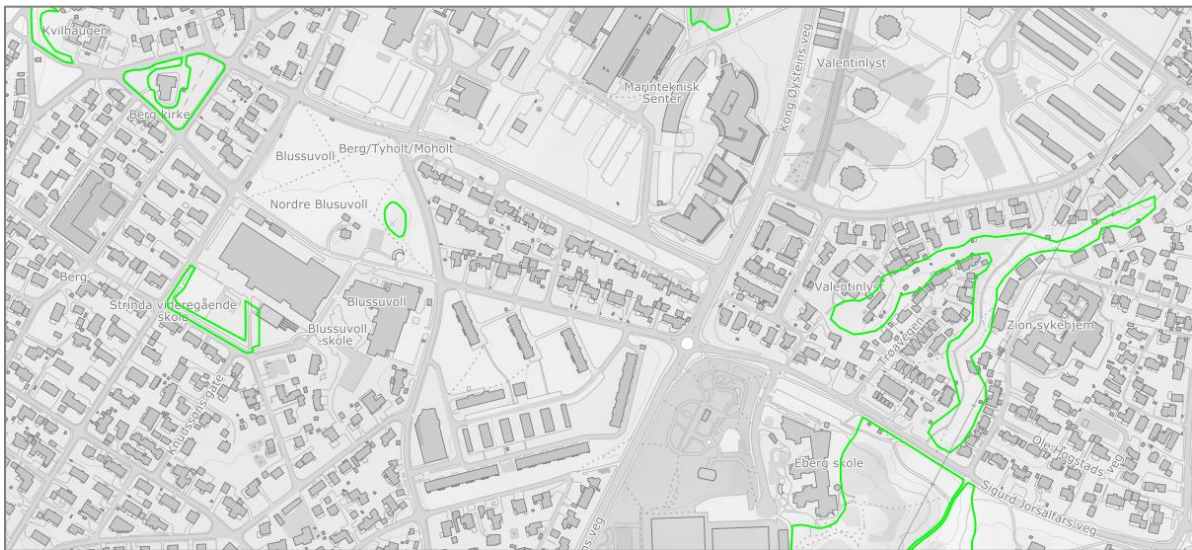
Figur 3: Naturtyper registrert som «lokalt viktig» i Trondheim kommunes aktsomhetskart. Registreringene er markert med grønt omriss.

Disse registreringene er vist i Figur 3.