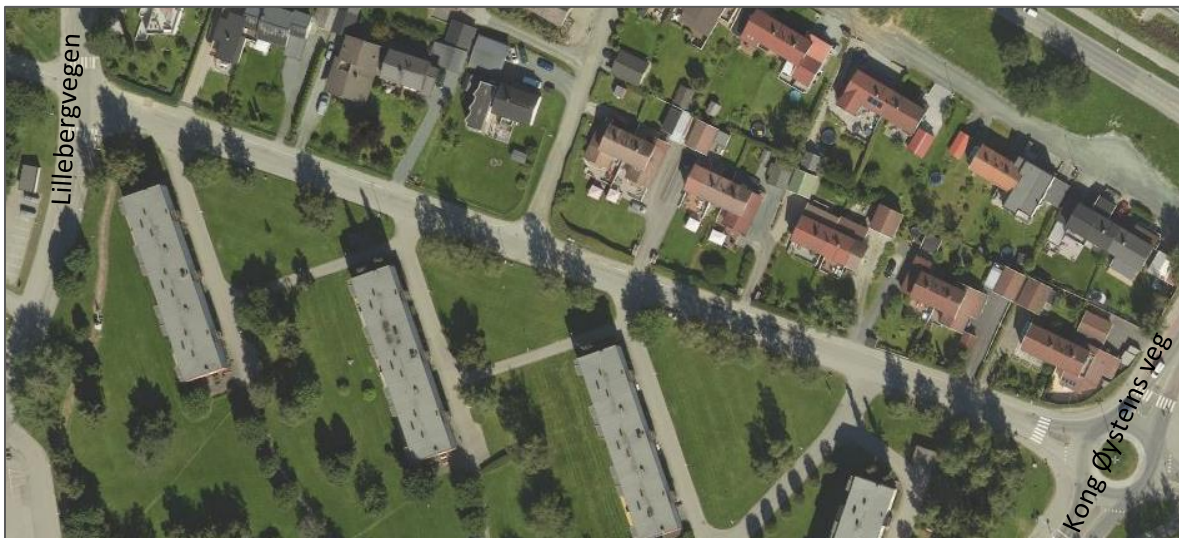
Figur 6: Trekke mellom Lillebergvegen og Kong Øysteins veg.

Langs strekningen står det flere trær som har en viktig funksjon for nærmiljøet. Mellom Lillebergvegen og Kong Øysteins veg, i tilknytning til Blusuvold borettslag, står det en rekke med bjørketrær, se Figur 6. Disse trærne har en viktig funksjon for nærmiljøet ved at de bidrar til trivsel, støydemping og demping av vind.