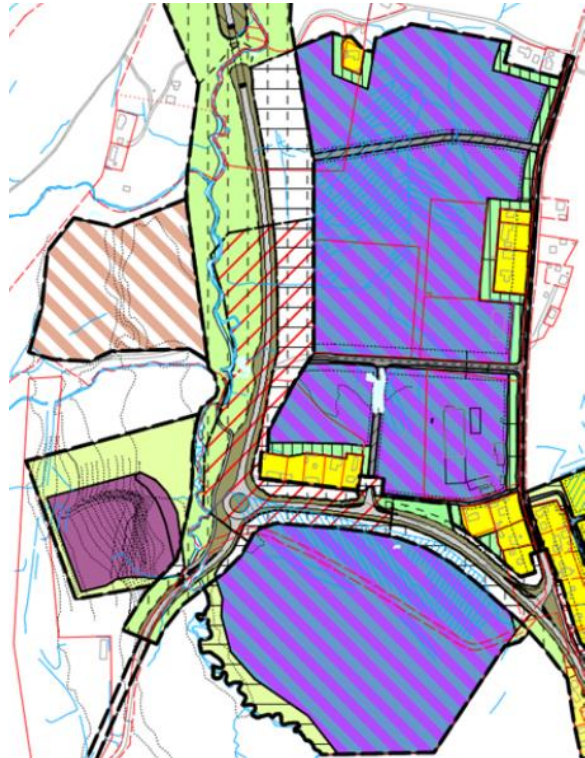
Gjeldende plan med plan for ny fv 704, vedtatt 6.6.2019