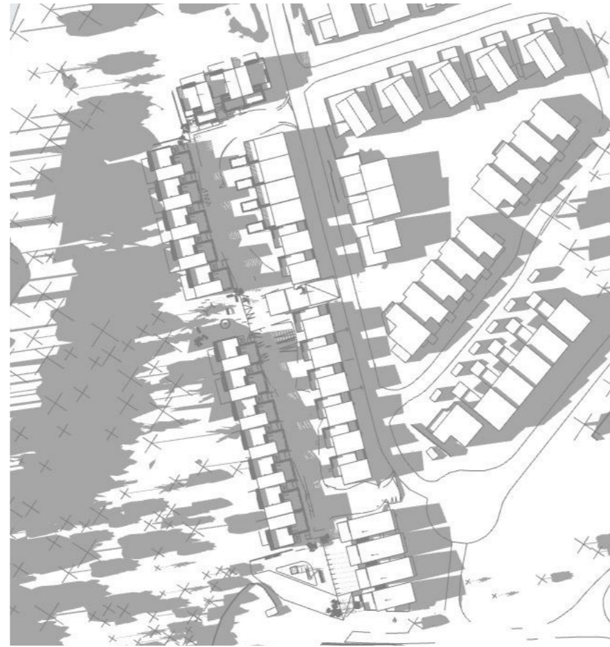
22 April kl.15