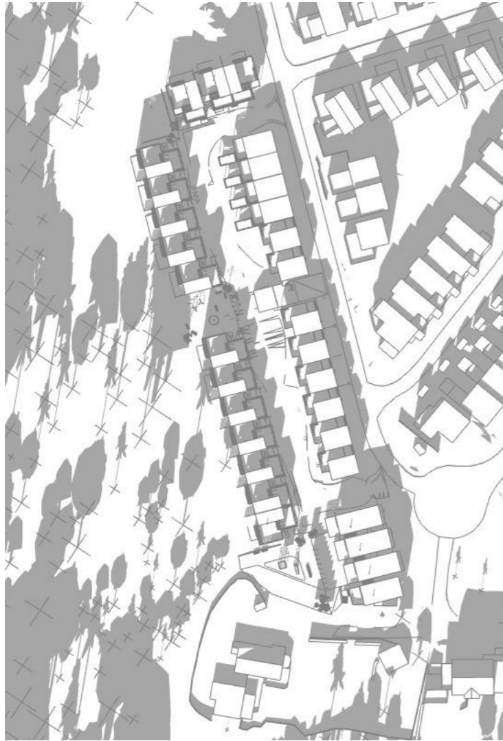
21 Mars kl. 12 1:200