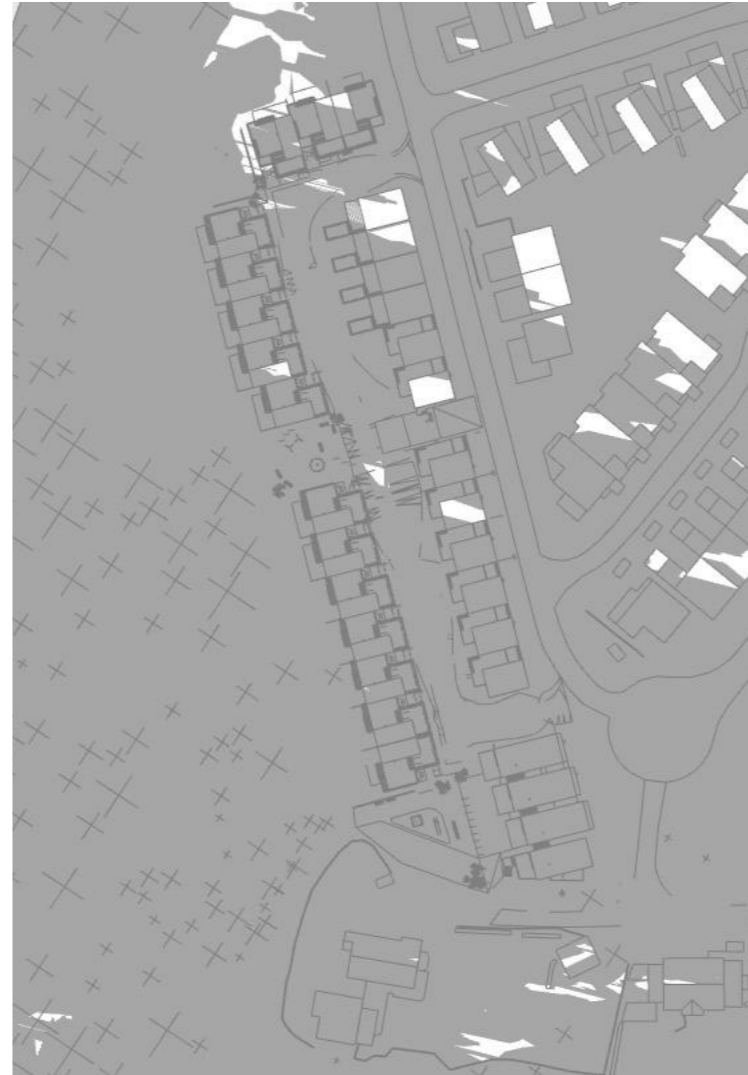
21 Mars kl. 18 1:200