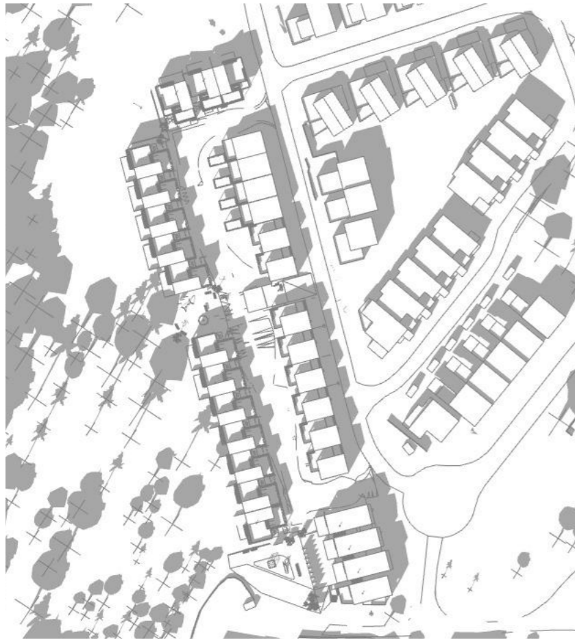
22 April kl.12