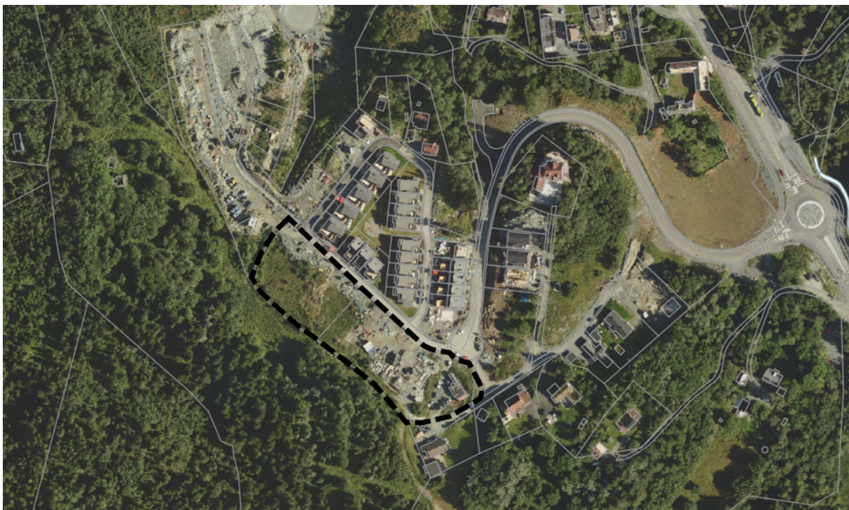
Figur 2: Flyfoto dagens situasjon

Det er ikke registrert verneverdige kulturminner i området og heller ikke sårbare eller truet flora eller fauna.