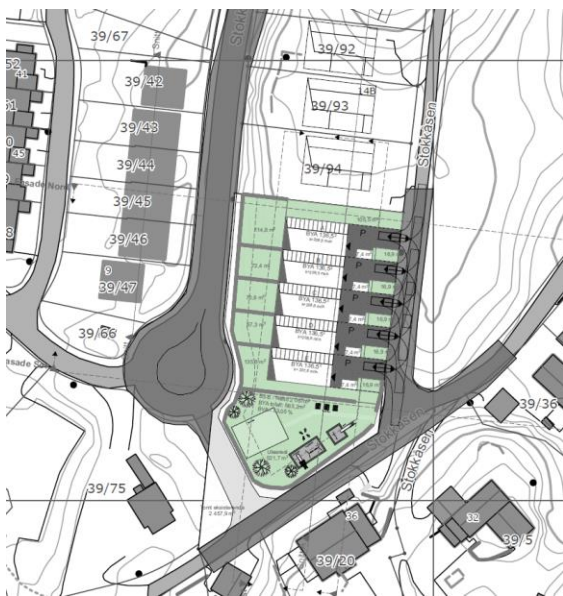
Figur 1: Situasjonsplan Stokkåsen boligfelt B3-b

På Stokkåsen, i Trondheim kommune, skal det etableres 5 nye boliger på gnr/bnr 39/6. Situasjonsplanen for Stokkåsen boligfelt B3-b er vist på figuren nedenfor.