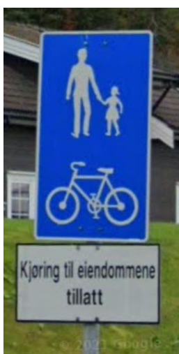
Figur 1 Vurdering av trafiksikkerhet for skoleveg alternativ sør.

Skolevegen fortsetter på en ny gangveg (3) som etableres på adkomsten som går inn mellom Gildheimsvegen 9A og 17. Denne vegen benyttes som biladkomst til Gildheimsvegen 9A-17, totalt ni adresser. På grunn av eksisterende bebyggelse er det ikke rom for å separere gående og kjørende her. På en strekning på 80 meter vil dermed gangvegen måtte benyttes av biler som kjører til og fra eiendommene Gildheimsvegen 9A-17. Det finnes eksempler andre steder i Trondheim hvor det praktiseres skilting med «Kjøring til eiendommene tillatt». På grunn av et begrenset antall boliger som vil benyttes denne gangvegen som biladkomst og en forholdsvis kort strekning, er det vurdert at strekningen kan aksepteres som skoleveg. Likevel er kombinasjonen gangveg og biladkomst ikke en løsning som anbefales som skoleveg, spesielt ikke i dette tilfellet hvor det er fare for at biler rygger fra trange parkeringsplasser ved eiendommene og ut i gangvegen. Dersom gangvegen etableres som skoleveg, foreslås det etablering av ny oppstilling for avfall for Gildheimsvegen 9A-17 i Gildheimsvegen, for å unngå at renovasjonsbiler kjører inn gangvegen med behov for å rygge ut igjen, eller å rygge og snu over gangvegen.