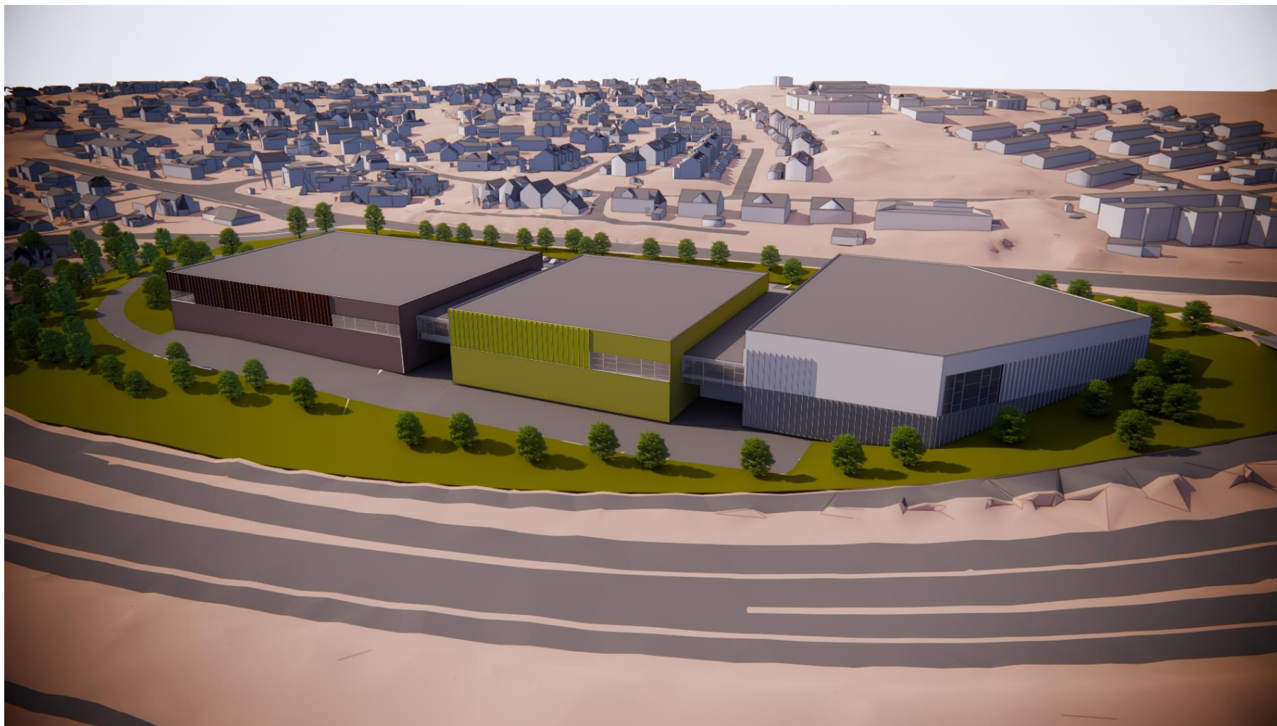
Fugleperspektiv sett fra nord, E6 i front og Kochaugvegen / Charlottenlund i bakgrunnen. Alternativ med vertikalt rett fasade.