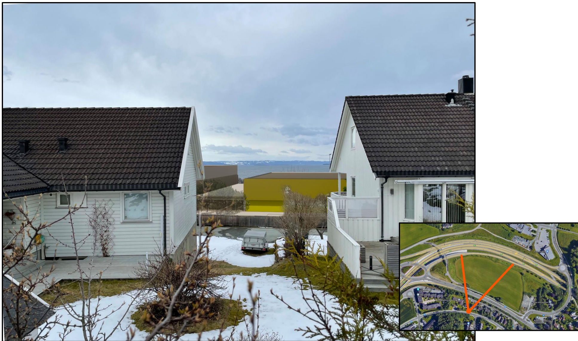
Fotomontasje sett fra Hørlocksveg mellom husnr. 70 C (til høyre) og 70 D (til venstre), noe over boligens første etasje.