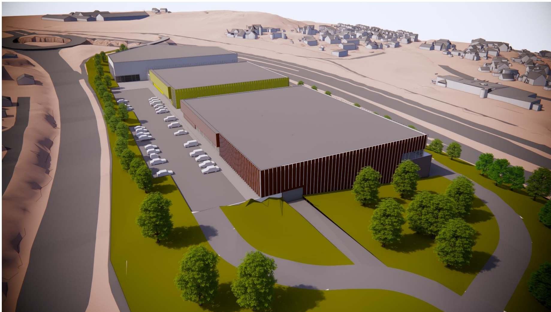
Fugleperspektiv sett fra sørøst, over krysset Kochaugvegen/Grilstadvegen. Alternativ med svakt inntrukket fasade (horisontalt sprang) mot nord/E6.