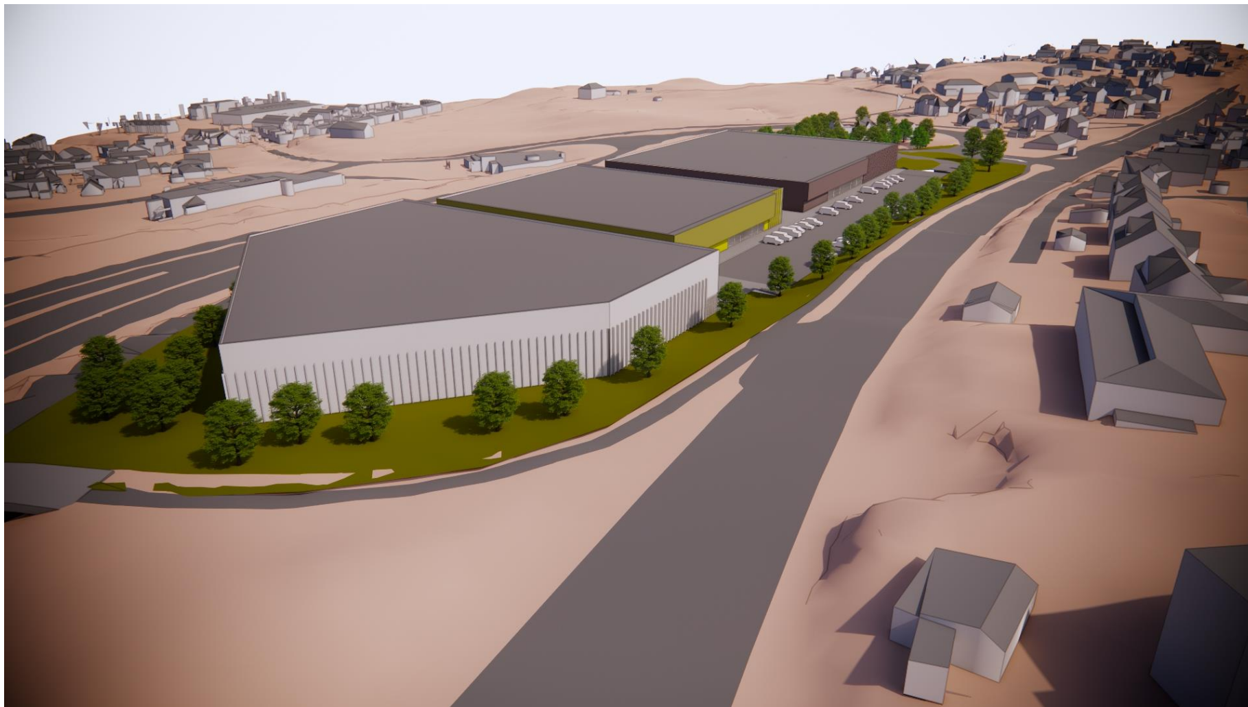
Fugleperspektiv sett fra sørvest, Kochaugvegen i forgrunnen. Effekten av delvis inntrukket fasade er ikke merkbar på bakkenivå fra denne retningen.