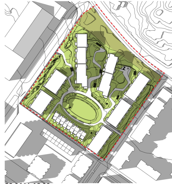
23.06 kl. 18:00