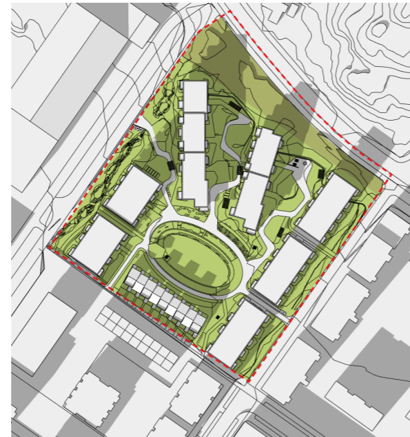
21.03 kl. 15:00