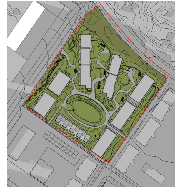
22.04 kl. 20:00