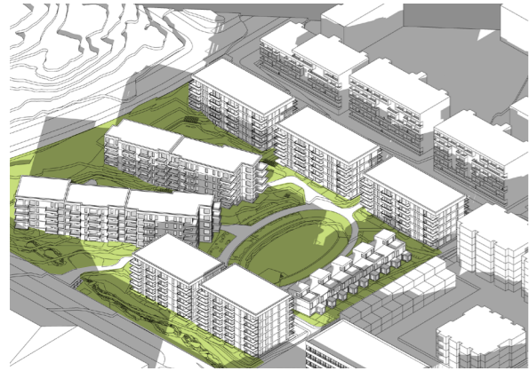
22.04 kl. 19:00