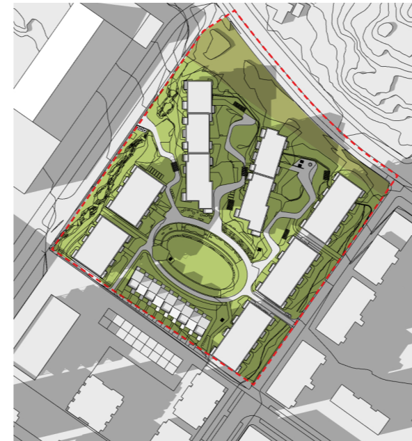
22.04 kl. 18:00