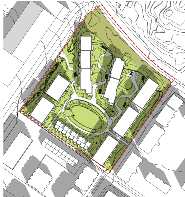
22.04 kl. 12:00