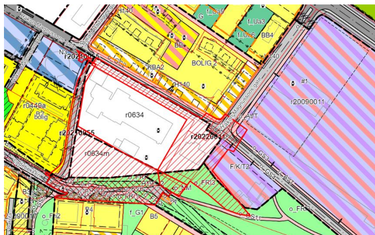
FIGUR 2 UTKLIPP FRA REGULERINGSPLAN KARTPORTAL

Planområdet befinner seg i nærheten av flere betydelige utbyggingsområder. Lilleby område B4 var den største pågående utbyggingen i nærheten av planområdet på tidspunktet da denne overordnede VA-planen ble utarbeidet.