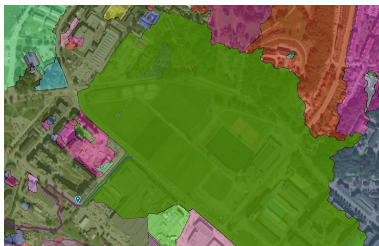
FIGUR 3 UTKLIPP FRA SCALGO LIVE SOM VISER TEORETISKE NEDSLAGSFELT OG AVRENNINGSLINJER