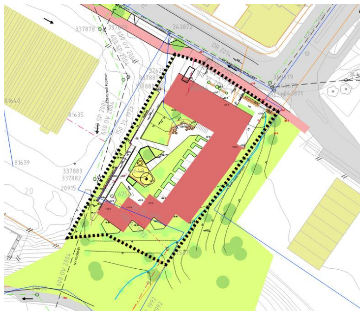
FIGUR 5 NEDBØRSFELT FOR OVERVANNSHÅNDTERING

Areal vist i skisse under er på cirka 0,2 ha og beregnes som nedslagsfelt for planområdet.