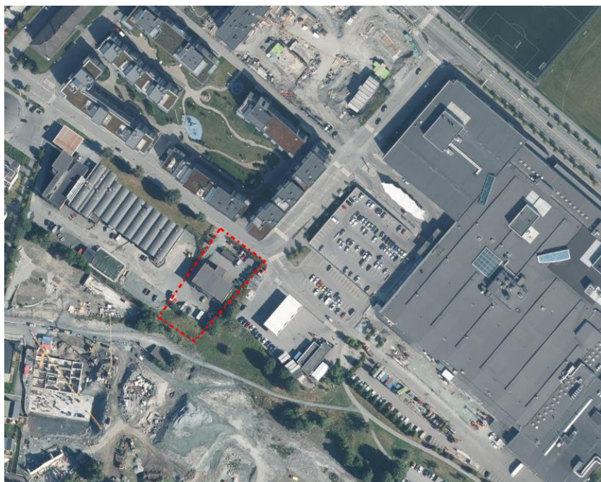
FIGUR 1 PLANOMRÅDET HÅKON MAGNUSSENS GATE 9

Før igangsettingstillatelse for VA og byggestart må løsningene for VA være teknisk plangodkjent av Trondheim kommune v/ kommunalteknikk.