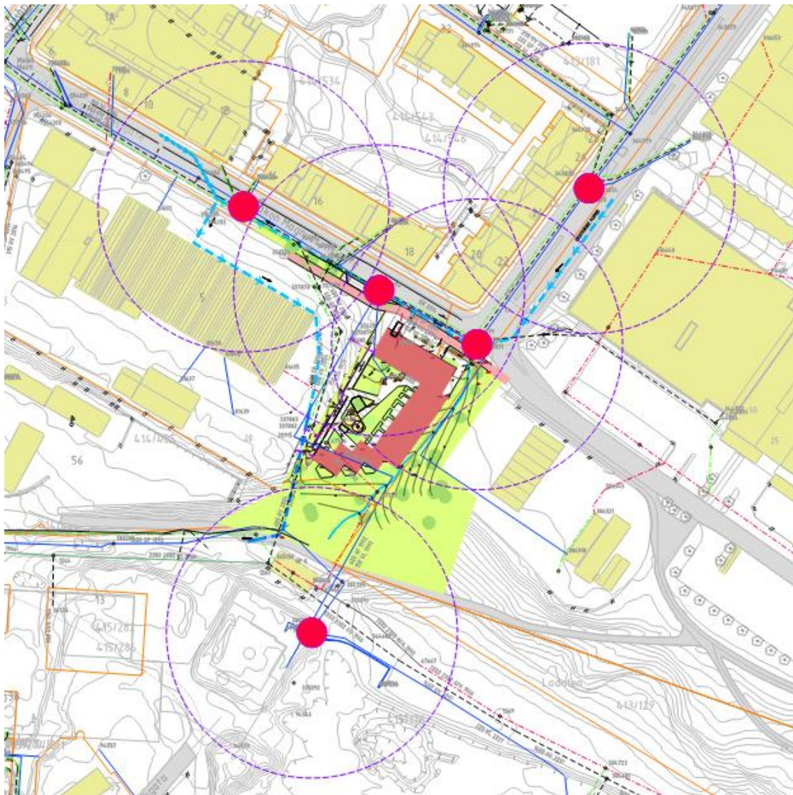
FIGUR 4 OVERSIKT OVER EKSISTERENDE SLOKKEVANNUTTAK MED DEKNINGSRADIUS 50M

VL DN150 2004 ligger i Håkon Magnussons gate. VL DN150 1971 og ligger på langs og tvers inne i planområdet. Figur 4 viser eksisterende slokkevannuttak i nærheten av planområdet.