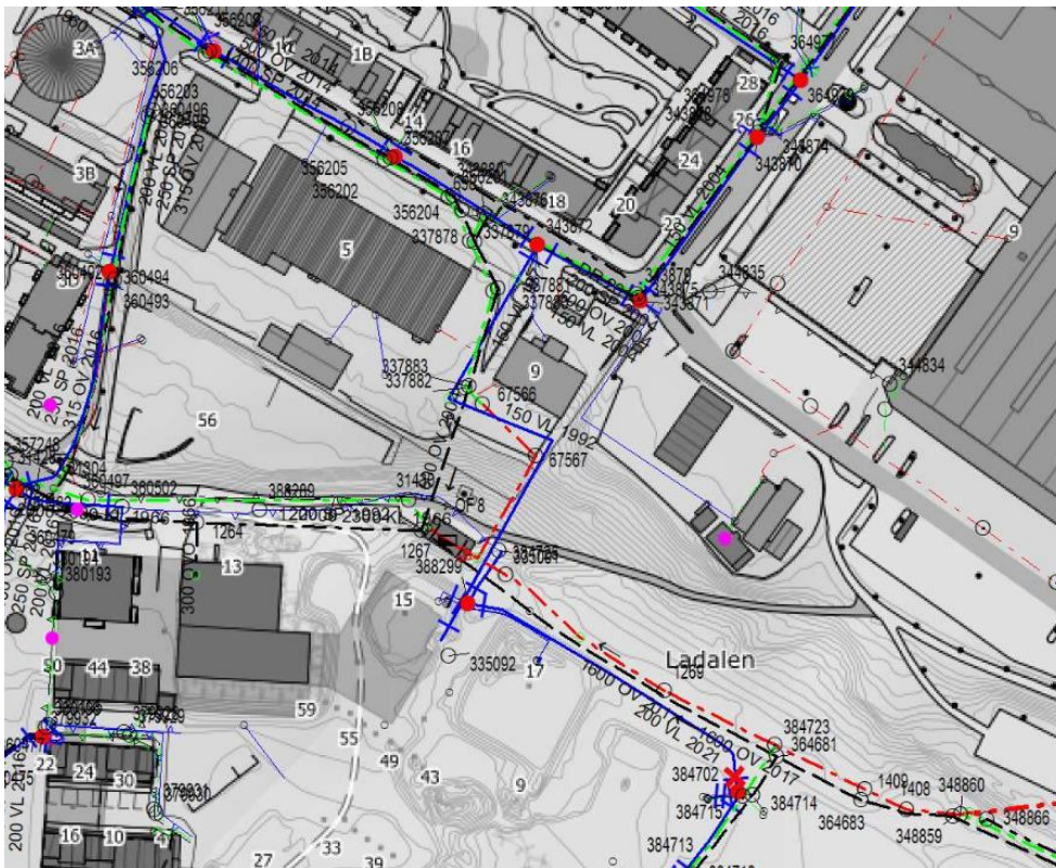
FIGUR 3 EKSISTERENDE VA-KART

Stikkledninger for avløp fra eksisterende bebyggelse innenfor planområdet er i dag tilkoblet K-AF600 1992 i skråningen ned til Ladalen avløpsstasjon. Vannforsyning til eksisterende bygg er tilknyttet kommunal vannledning i Håkon Magnussons gate.