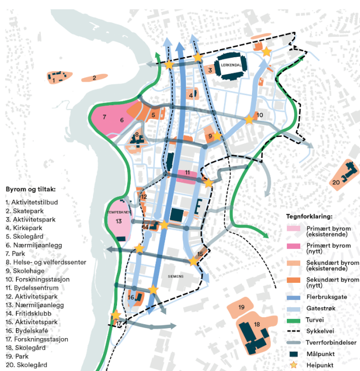
Figur 2 Strategisk kart for offentlige byrom og forbindelser. Rambøll 2023

Dette gir et nettverk av sosiale møteplasser innenfor bydelen, og ivaretar også forbindelser for gående og syklende i det større nettverket i og utenfor planområdet.