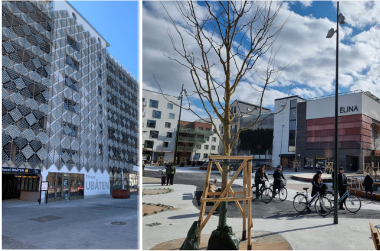
Figur 4 Eksempel på mobilitetshus fra Malmø. Til venstre «Ubåten p-hus» på Västra hamnen. Til høyre «Elina» som dekker boliger i 500 meters radius.

skråningen mot Nidelva skal det blant annet etableres boliger tilrettelagt for familier. Innenfor sentrumsformålene blir det funksjonsblanding med både bolig/kontor/tjenesteyting mm. Det er avsatt areal til skole ved Valøya som kan bygges når det oppstår et behov. Det åpnes for at det kan etableres midlertidige sosiale boligtiltak og etableres lekeplass som ikke er til hinder for fremtidig skoleanlegg.