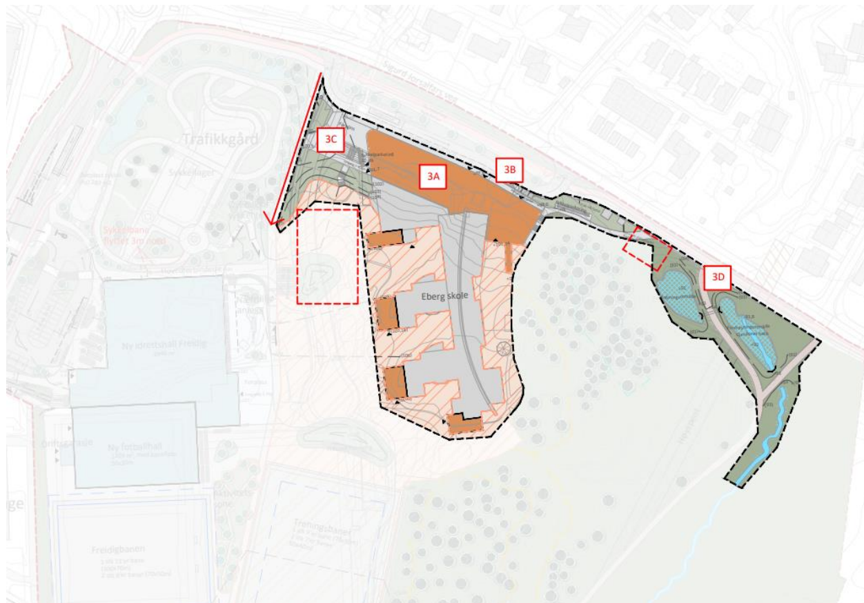
Figur 3: Illustrasjonsplan som viser byggetrinn 3.

Ved utvidelse av Eberg skole, må byggevirksomheten planlegges i samråd med skolen. Det er ønskelig at anleggsfasen legges til skoleferien.