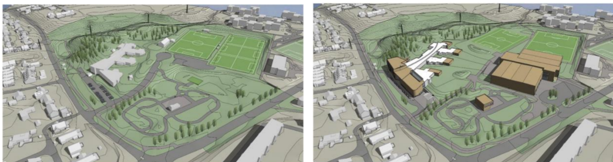
Eksisterende og ny situasjon, med full utbygging.

Nytt servicebygg for trafikkgården: Planforslaget legger til rette for en utvidelse av servicebygget i trafikkgården. Det er behov for blant annet toaletter, undervisningsrom for 30 personer, sykkelverksted og lager. Det tillates et bygg på to etasjer med et maksimalt fotavtrykk på 200 m 2 .