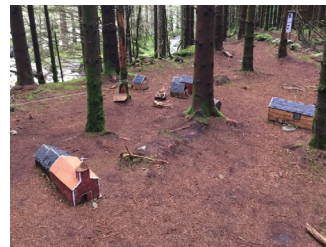
"Tusseløypa" i granskogen nord for Jarleskjela. Rasteplass med nærhet til barnehager og skoler. Tilrettelegging for diverse aktiviteter særlig med tanke på opphold, samvær og fysisk aktivitet for barn. (Referanse: Eventyrskogen i Ardal)