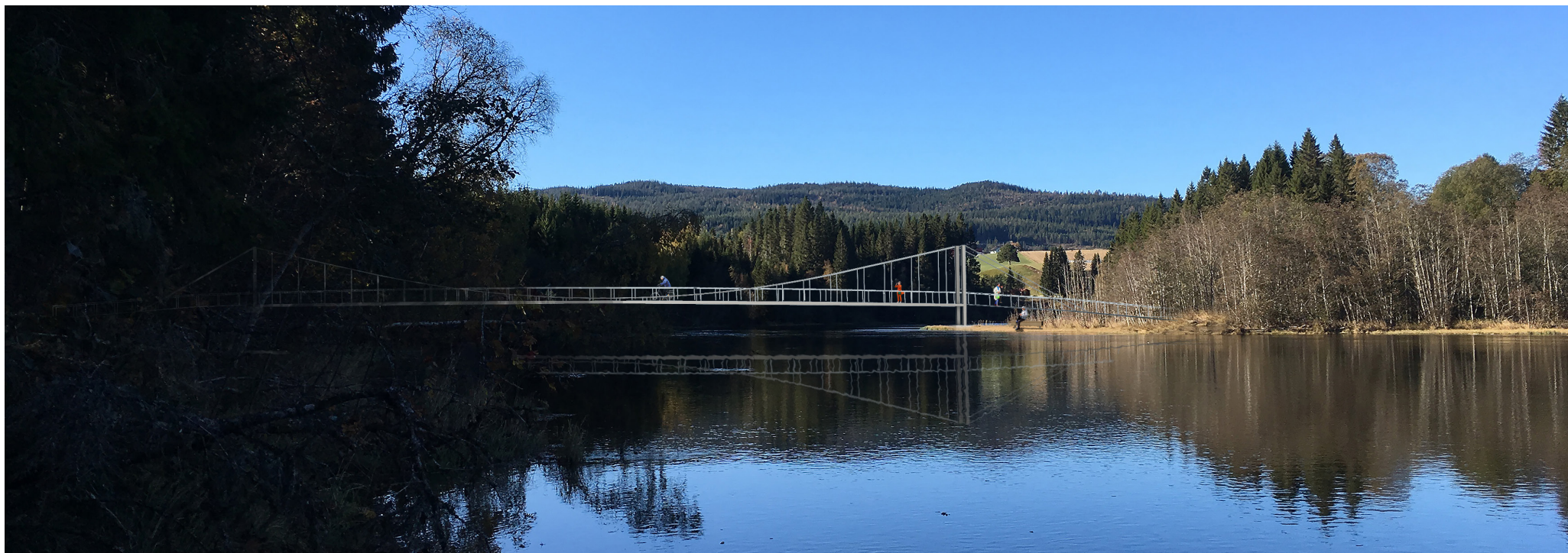
Ny hengebru over Nidelva ved Storvollen.