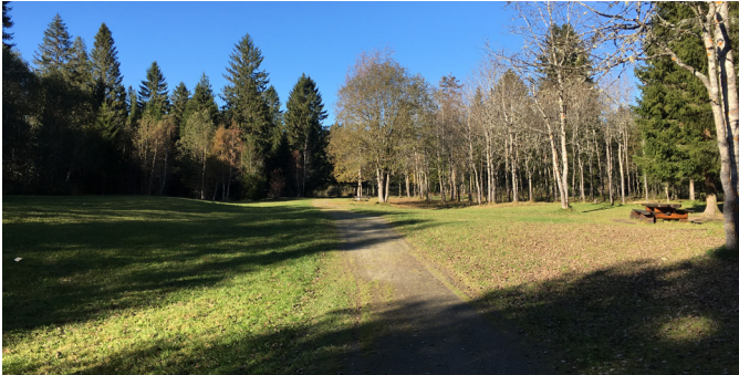
10 Eksisterende parkering, toaletter, benker mm. ved Moodden friluftspark.