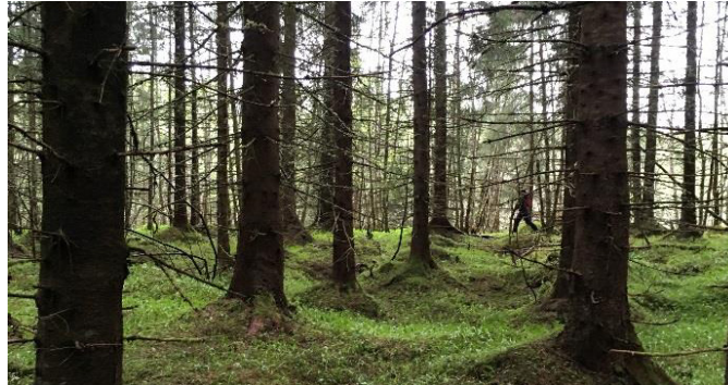
13 Eksisterende hvileplasser i granskogen ved Løkkaunet.