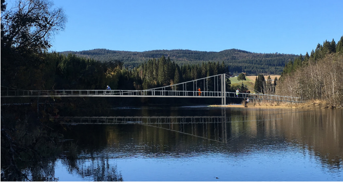
9 Ny hengebru og rasteplass ved utløpet av Storvollbekken.