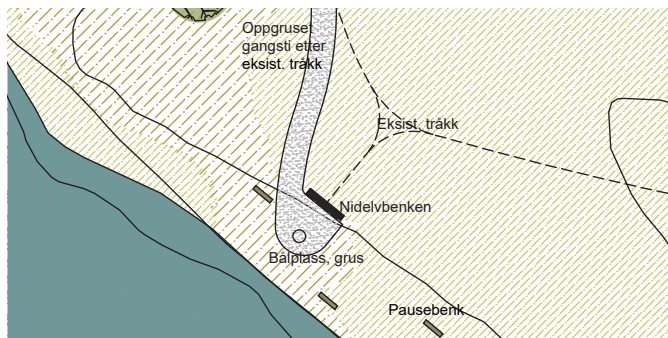
Rasteplass Gjellifitja med "Nidelvbenk", bål plass, benker mm.