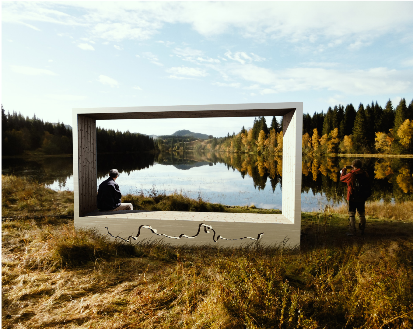
Eksempel på "Nidelvbenk" og mulig benk langs stien.