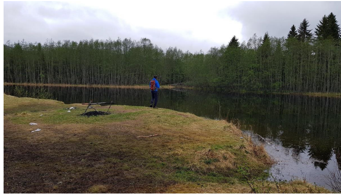
12 Eksisterende bål plass, benker mm. ved Løkkaunet kan fornyes.