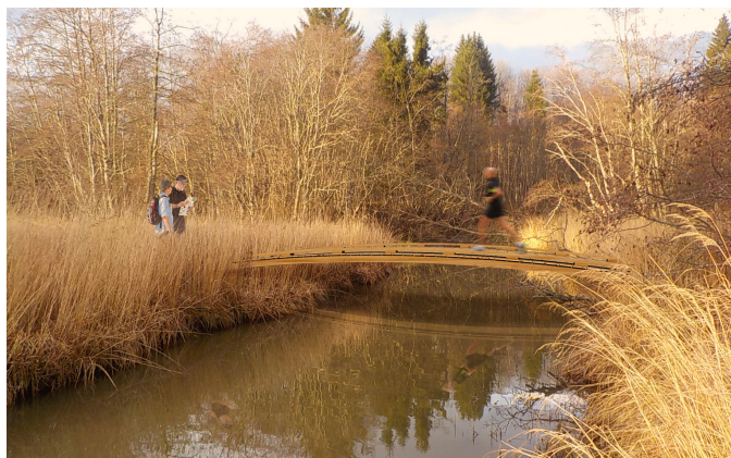
Eksempel på klopp og en liten bru ved kryssing av bekk langs stien.