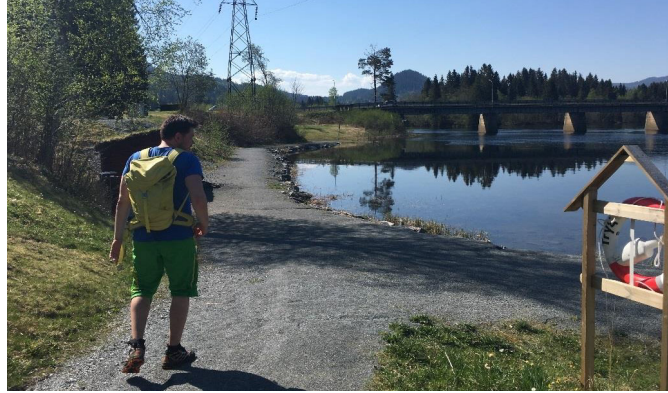
11 Eksisterende benker og gapahuk mm. ved Svean friluftspark.