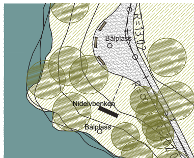
Rasteplass med "Nidelvbenk", bål plass, benker mm. sørvest for Villmoen.