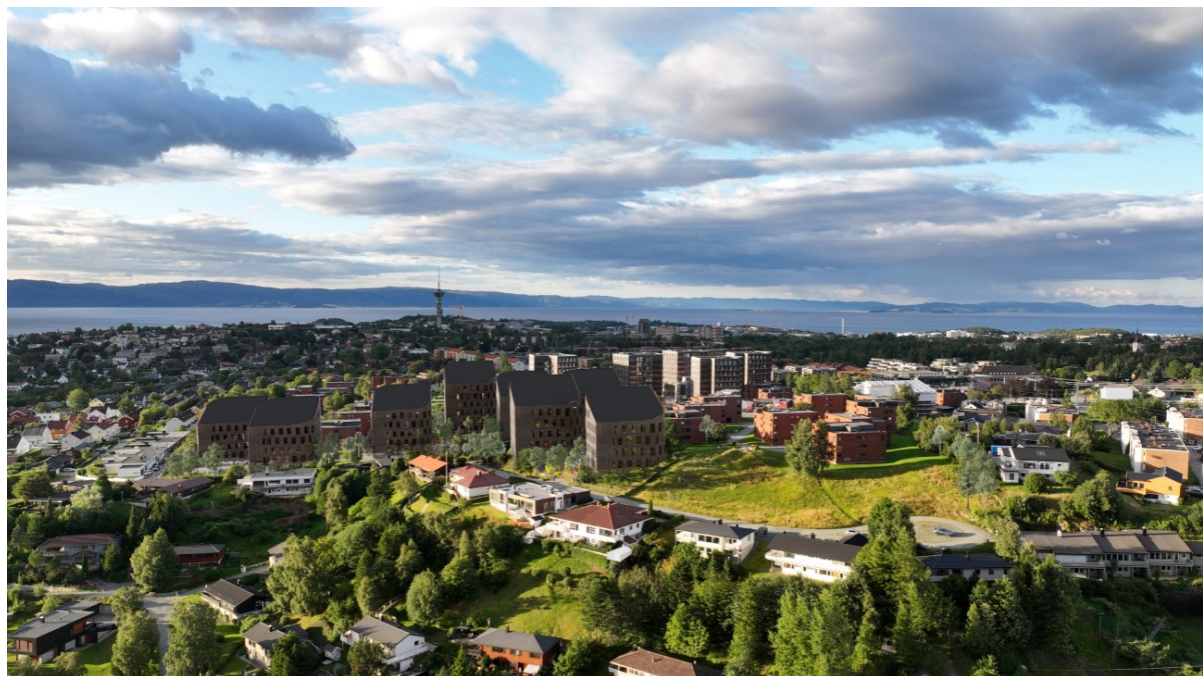
Studentsamskipnaden i Gjøvik, Ålesund og Trondheim