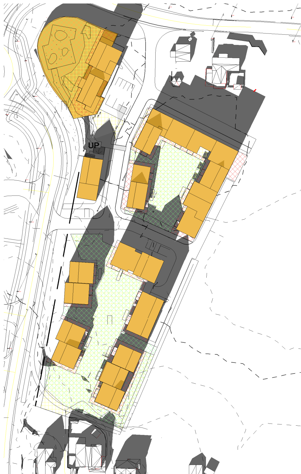
21.mars kl.15 Solbelyst areal på bakken: ca 3800m 2