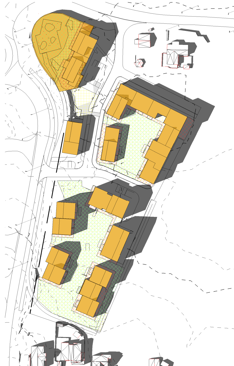
23.juni kl.18 Solbelyst areal på bakken: ca 4400m 2