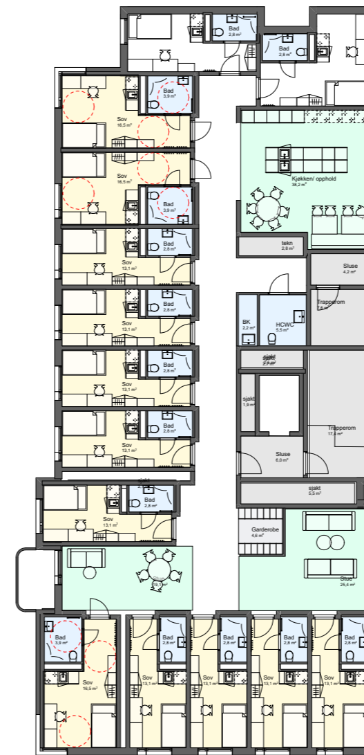
2. etasje (2. - 5.etasje er like)

Rommet merket disp. studentaktiviteter har potensiale til å bli et fint fristed for studentene. Her tenker vi det er viktig med brukermedvirkning i planleggingen. Kanskje vil de ha hobbyrom, treningsrom, yogastudio, verksted eller musikkounge?