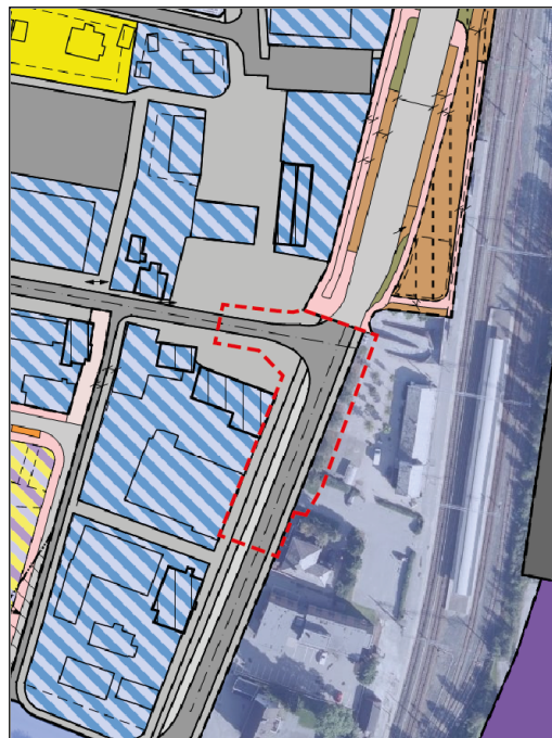
Plangrense med omkringliggende reguleringsplaner.

Det er stilt rekkefølgekrav om opparbeidelse av venstresvingefeltet i gjeldende reguleringsplan for Anne Ekrens veg og Hans Michelsens veg, gnr/bnr 198/5 m.fl. (r20150035), vedtatt 1.2.2018.