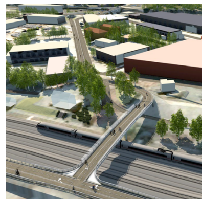
Ny bru sett mot sør