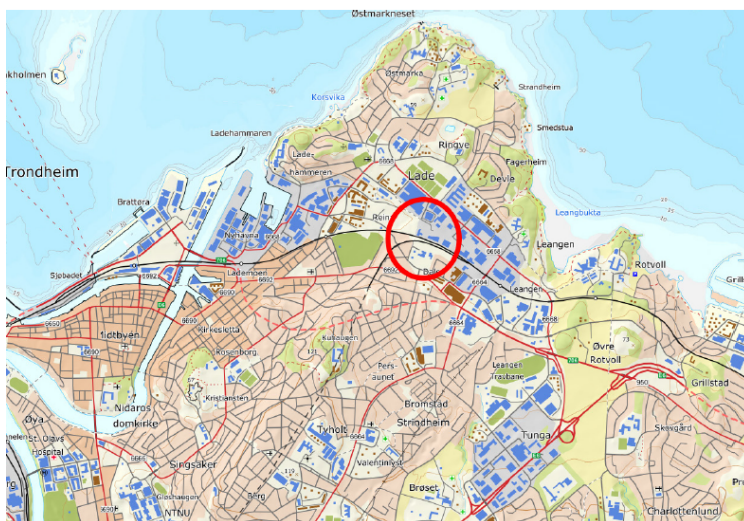
Hovedsykkelveg går fra Lilleby i vest til Rotvoll i øst

Reguleringsplanforslag utarbeidet av ViaNova Trondheim og Selberg arkitekter AS på vegne av forslagsstiller, som er Miljøpakken Statens vegvesen.