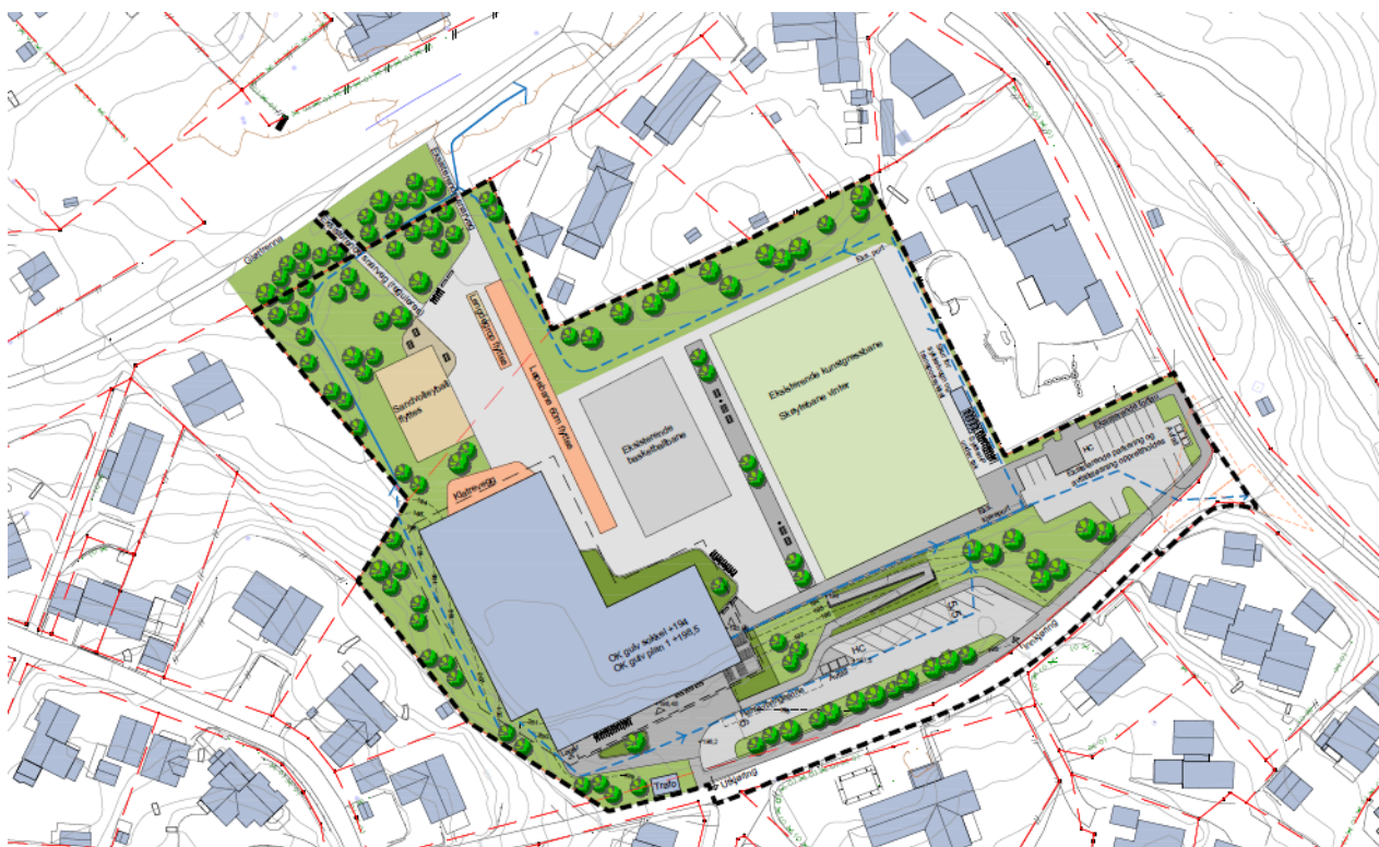
Over: illustrasjonsplan, Asplan Viak

Det er tidligere utredet en rekke ulike tomter for et idrettsbygg for Byåsen IL, blant annet på Ugla skole og Dalgård idrettsbane. Disse alternativene er av ulike årsaker ikke aktuelle. En hall på Myra idrettsplass vil gi gode muligheter til å kombinere innendørs og utendørs aktivitet, og å utvikle Myra som et møtested for nærmiljøet. Hallen er foreslått plassert på en del av området hvor det i dag er lite tilrettelagt for aktivitet. Med noe flytting av aktivitetsflater opprettholdes dagens bruk, også islegging på vinteren. Isleggingen foregår på dagens kunstgressbane.