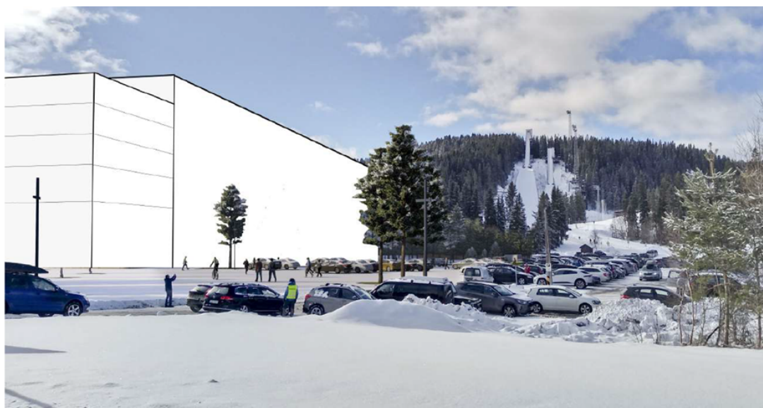
Over: Regulert volum av fotballhallen. Høyde reguleres til maks kote 200, og på frontpartiet 195. Bakken foran ved Kongsvegen er på ca kote 169.

Grunnforholdene i området er grundig dokumentert i områdeplanen med konsekvensutredning (KU) vedtatt i 2016. I vedlegg 11.2 i geoteknisk rapport er det bl.a. vist kostnadsoverslag for grunnarbeider ved ulike utbyggingsalternativ av fotballhall og i vedlegg 11.3, 11.4 og 11.5 er grunnforhold med torvdybder dokumentert.