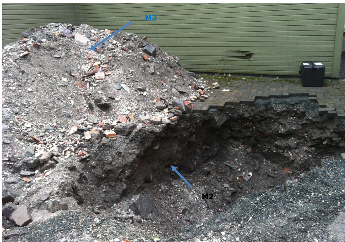
Figur 1: Oppgravd sjakt.