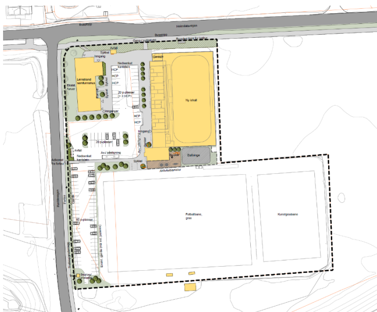
Alternativ B1 med garderobes mot vest