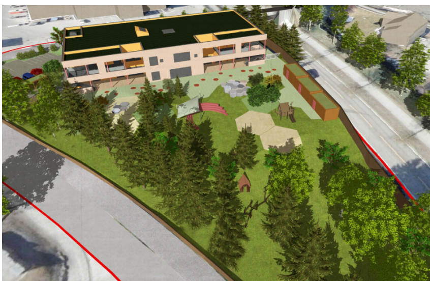
Figur 3: Perspektiv som viser barnehagen med uteområdet.

Utforming av barnehagens nye uteområder tar utgangspunkt i den eksisterende tomtens kvaliteter som naturtomt.