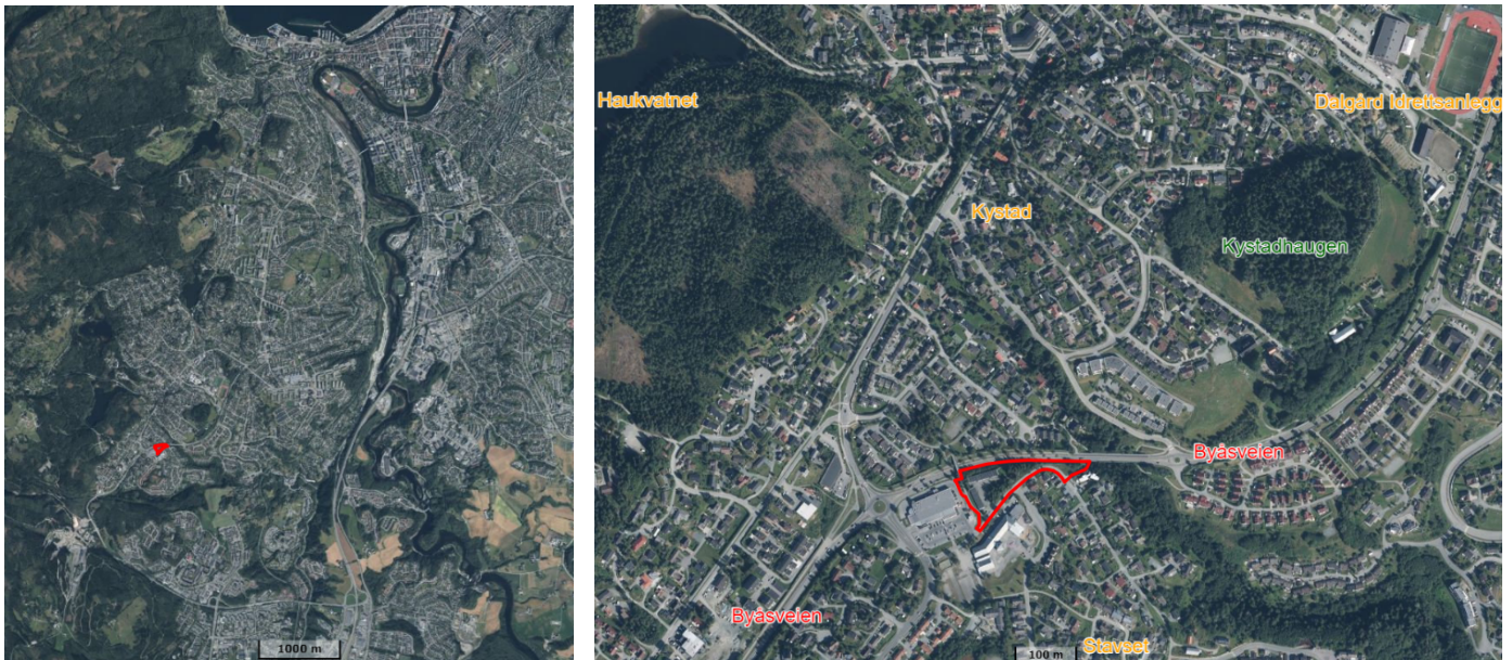
Figur 1: Planområdets plassering i Trondheim og i nærområdet

Reguleringsplanforslaget er utarbeidet av Selberg Arkitekter som plankonsulent, på vegne av forslagstiller Trondheim Kommune ved Utbyggingsenheten. Forslaget er utfyllende beskrevet i den vedlagte planbeskrivelsen.