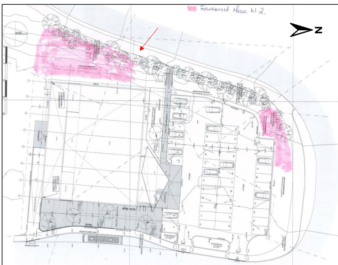
Figur 1.2: Kartet viser omfanget av gjenbrukte masser på området til Rema 1000 Kroppanmarka. Rosa skravur: masser i tilstandsklasse 2. Rød pil viser eksisterende sykkelvei, som skal utvides. Kilde: Multiconsult [6]

Ved Tonstadkrysset, like sør for tiltaksområdet ble det ved ombygging av Tonstad omstigningspunkt utført miljøtekniske grunnundersøkelser. Det ble bare påvist rene masser [7].