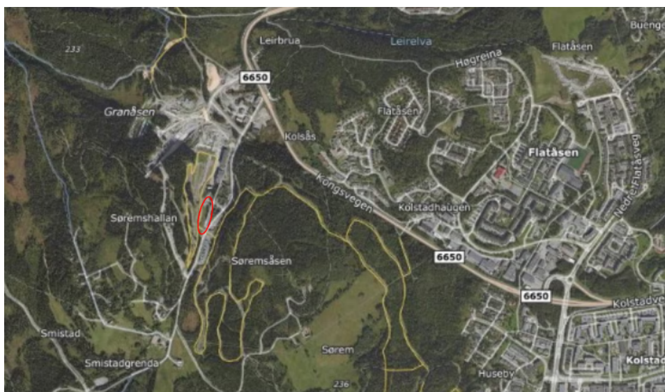
Figur 1 Oversiktsbilde med planområdet i rødt

Planområdet ligger i Granåsen idrettsanlegg, sør for skistadion og arenabygg, og mellom løypenettet og boligene langs Smistadvegen.