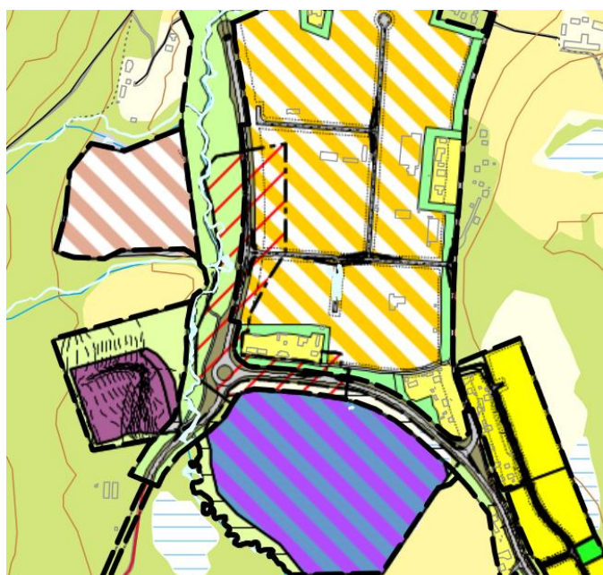
Gjeldende plansituasjon: Ny fv 704, vedtatt 6.6.2019, planendring nord for ny fv 704 vedtatt 11.10.2021