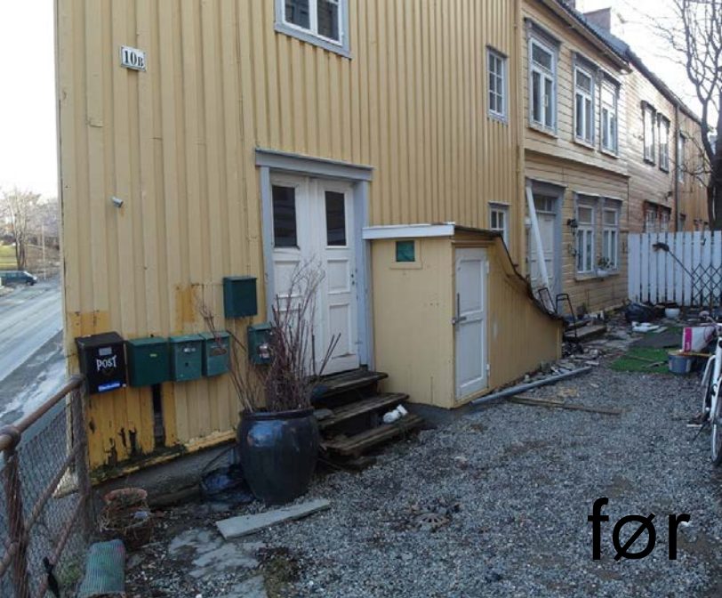
Grensen 10B - kommunal utleiebolig