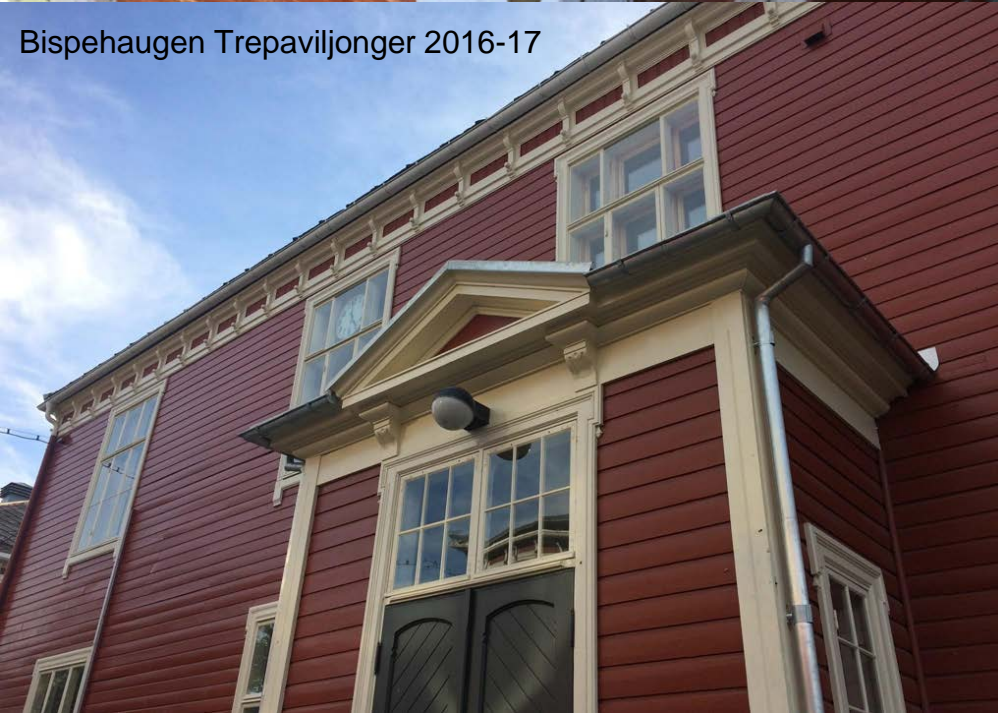
Bispehaugen Trepaviljonger 2016-17