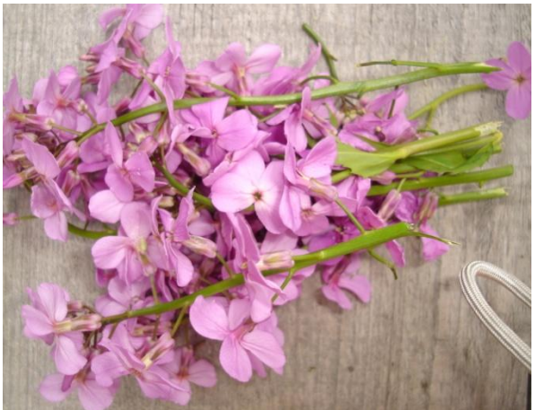
Tema for prosjektet: Skogen.