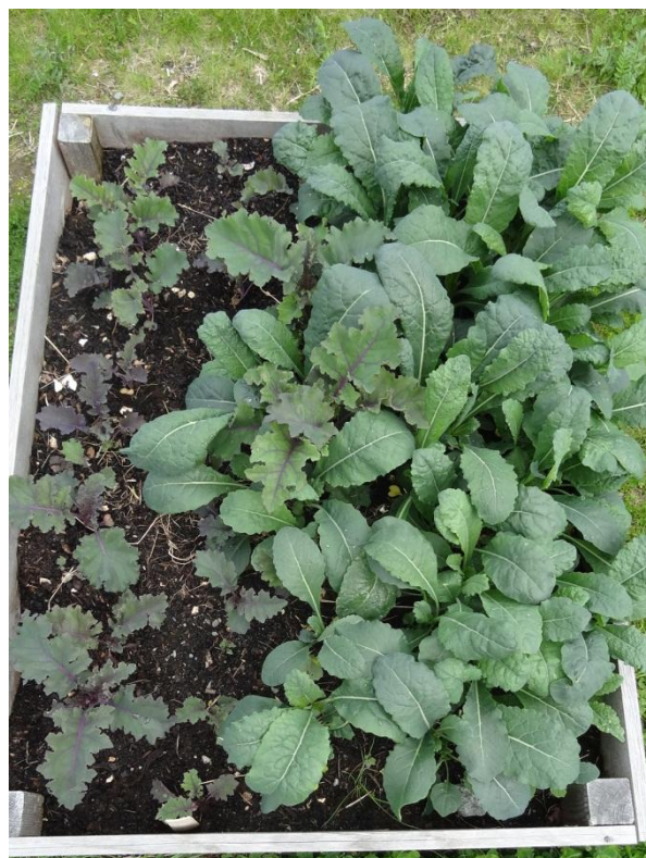
Salat, grønnkål, løk, sukkererter, poteter og ringblomster